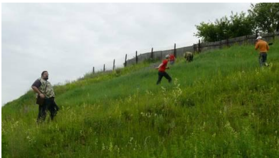
Обследование склонов городища Слобода

Во-вторых, школьники и учителя принимают активное участие в наших археологических исследованиях – как в летнее время в экспедициях, так и в течение учебного года