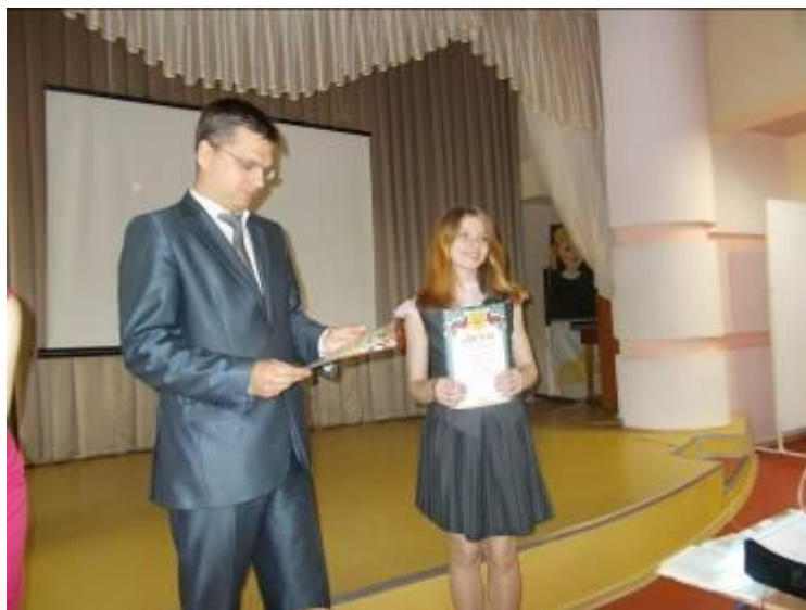
Вручение дипломов юным краеведам