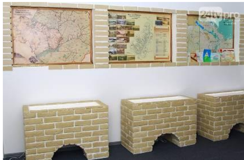
Музей в школе №59 г. Брянска