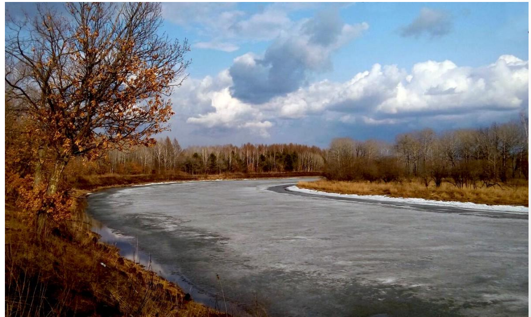
Джинганское озеро, вдоль которого находится кедровая роша. 13 апреля 2016 г.