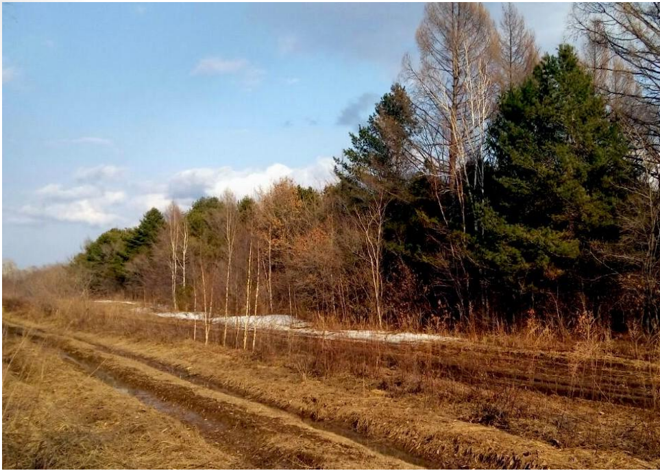
Граница участка кедровой роши. 13 апреля 2016 г.