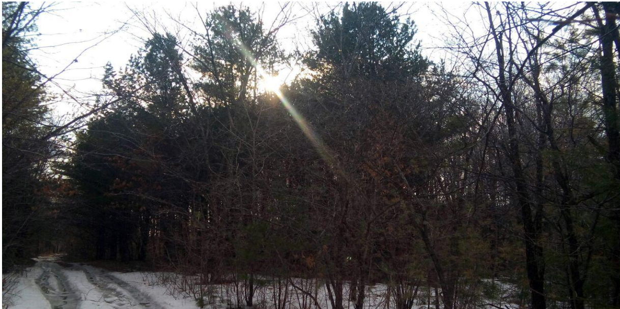
Кедровая роща на закате солнца. 13 апреля 2016 г.

Есть необходимость вести работу с этим кедровым участком с целью его регистрации и официального присвоения ему статуса «Памятник природы».