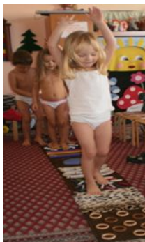
хождение по «дорожке здоровья»