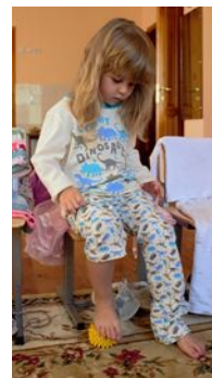
массаж активных точек