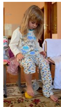
массаж активных точек