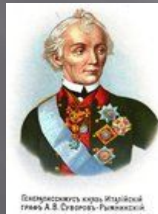
Генералиссимус князь Италийский граве А.В. Суворов-Рымникский