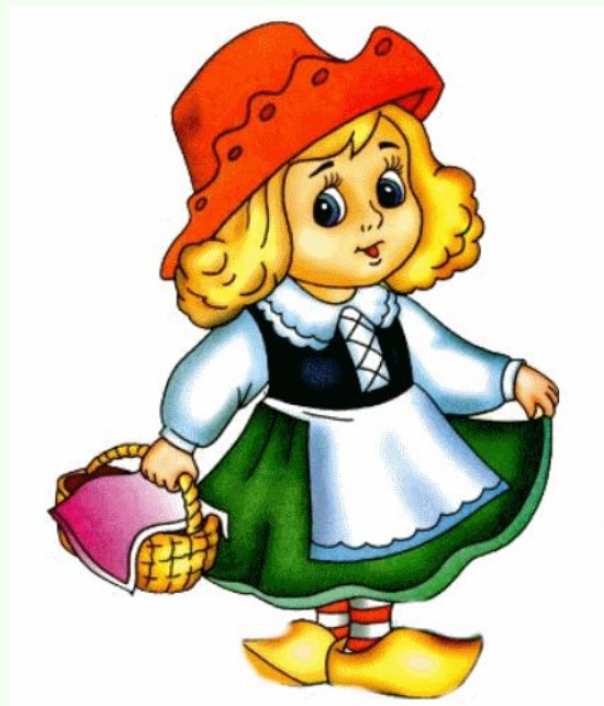
К асная шапочка