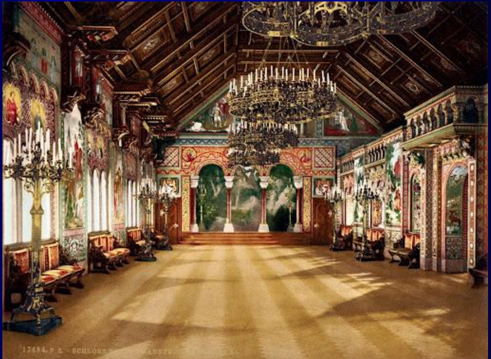
17194, P. 2 - SCHLOSS REICHTHUSHAUSEN - AUSTRIA