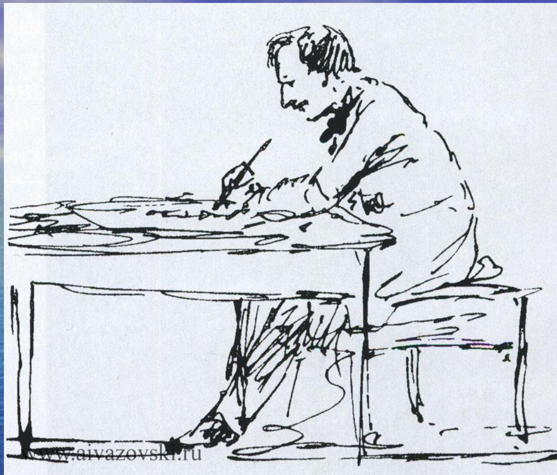
И.К. Айвазовский за письменным столом. Автопортрет. 1880