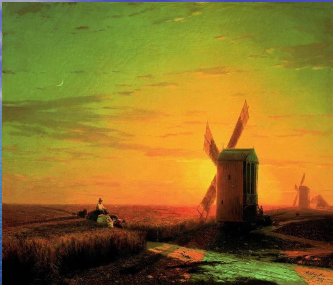
Ветряные мельницы в украинской Степи при закате солнца