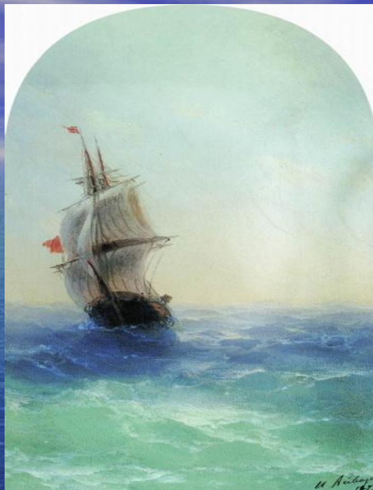
Бушующее море 1872