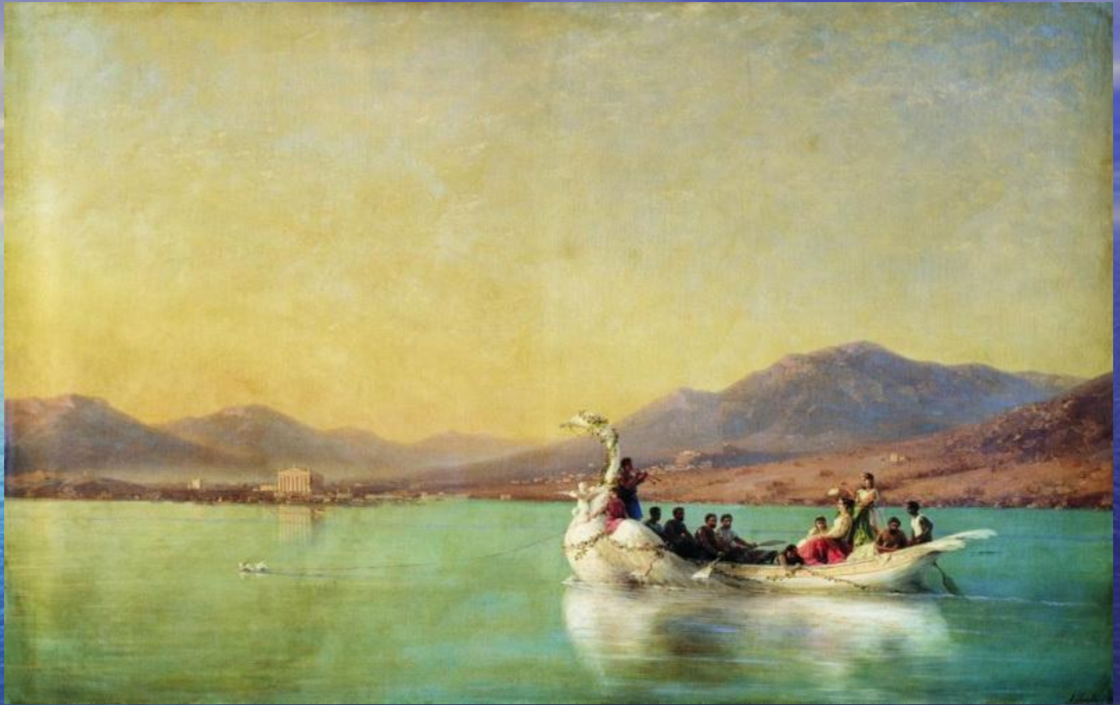
Венчание поэта в Древней Греции 1886