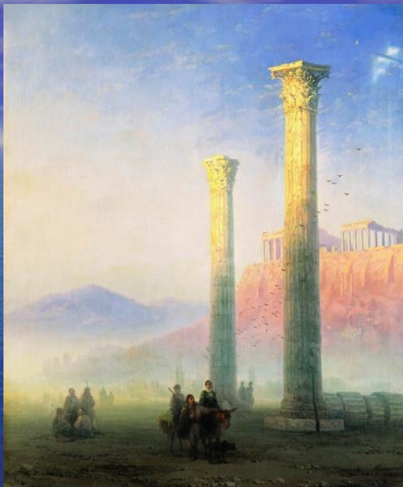
Афинский Акрополь 1883