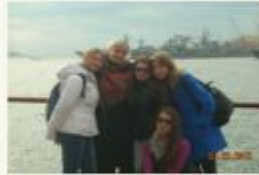
Люди, создающие будущее