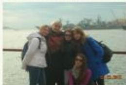
Люди, создающие будущее