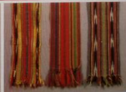
206 Пывэ вэвэвэ вэвэвэ вэвэ вэвэвэ Начало XX века Man's sash Hemp weaving fabric Southern Udmurtia Early 20th century Kutuvik folk song Dni Udmurtia XX, second half

Пывэ вэвэвэ вэвэвэ вэвэ вэвэвэ Начало XX века Man's sash Hemp weaving fabric Southern Udmurtia Early 20th century Kutuvik folk song Dni Udmurtia XX, second half