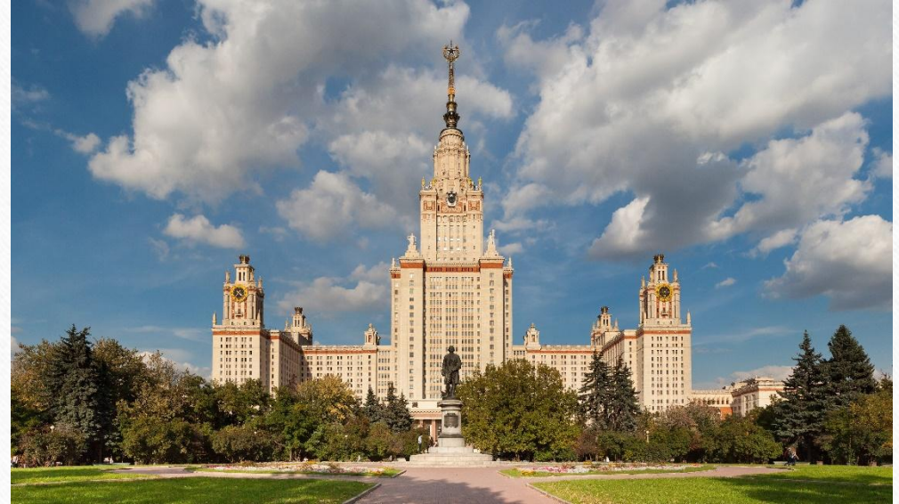
Московский государственный университет имени М.В. Ломоносова