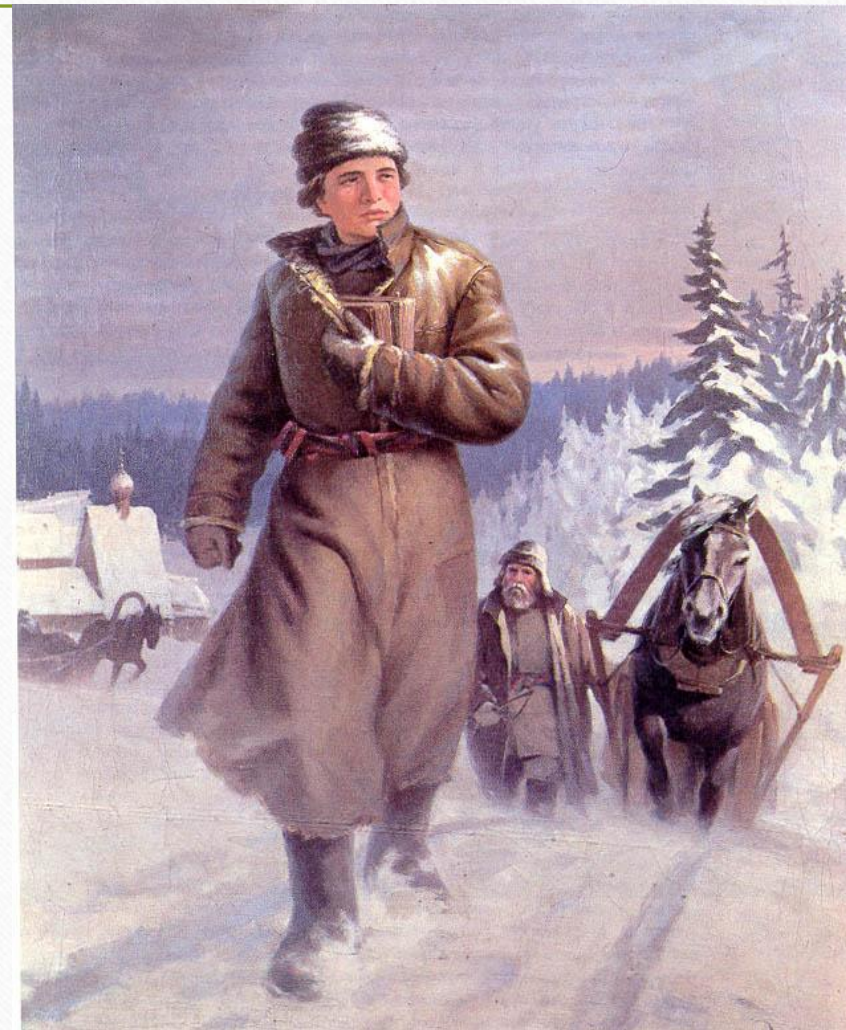
Н.И.Кисляков «Юноша Ломоносов на пути в Москву»

В 1735 году Ломоносов был вместе с другими двенадцатью учениками Спасского училища отправлен в Петербург и зачислен в студенты университета при Академии Наук.