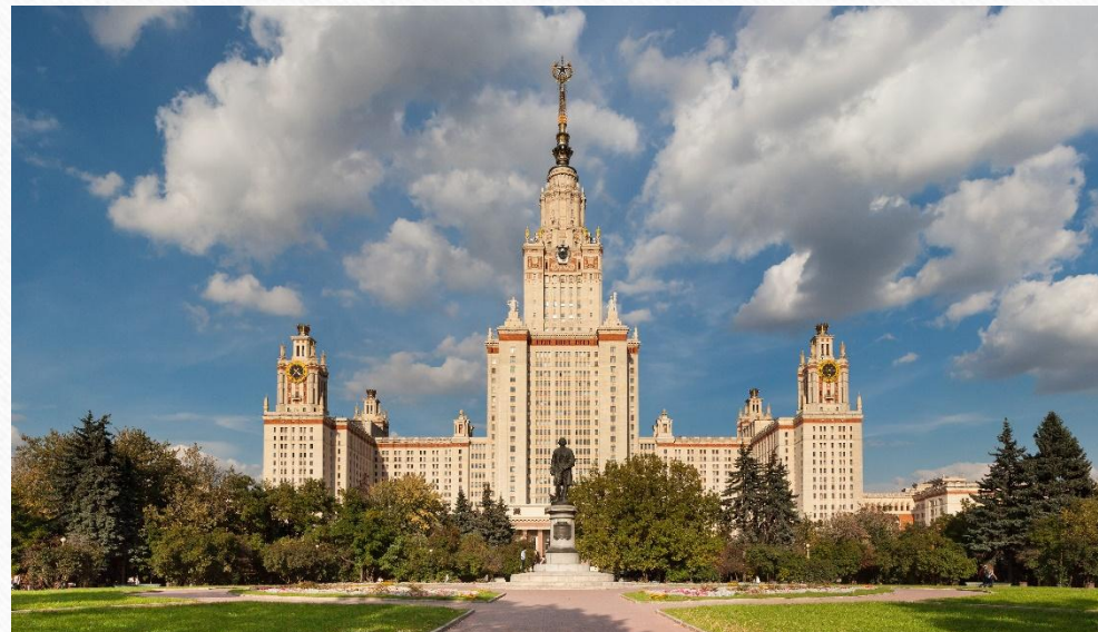
Московский государственный университет имени М.В. Ломоносова