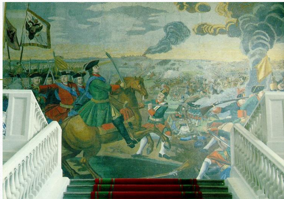
«Полтавская баталия». Мозаика М. В. Ломоносова в здании Академии Наук. Санкт-Петербург.