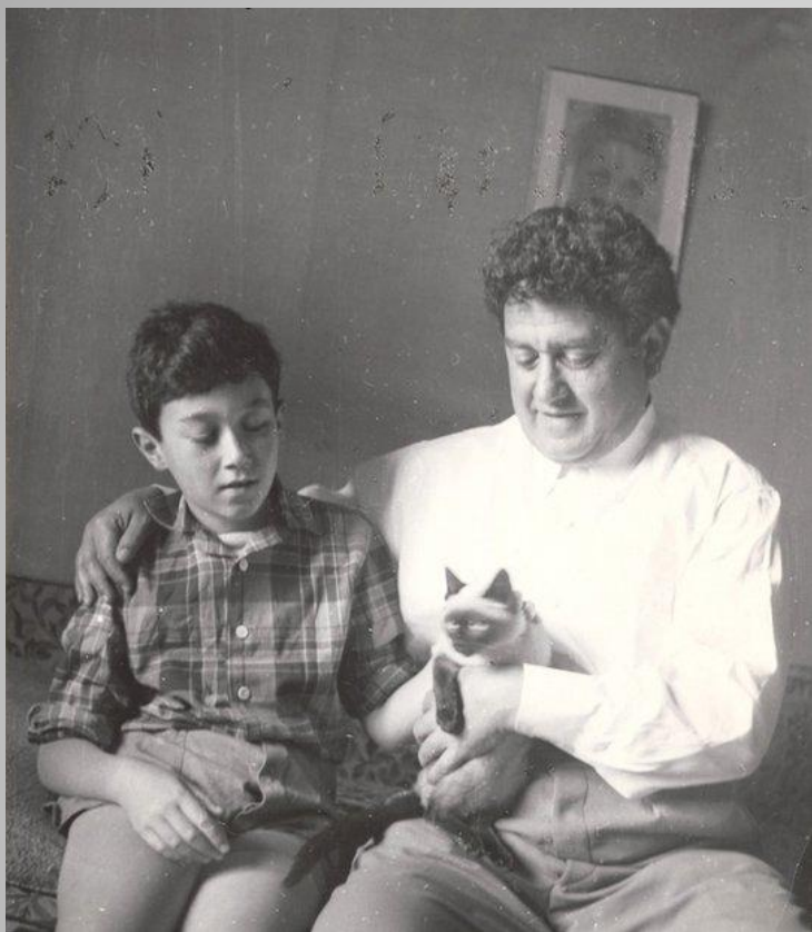
Драгунский с сыном Денисом