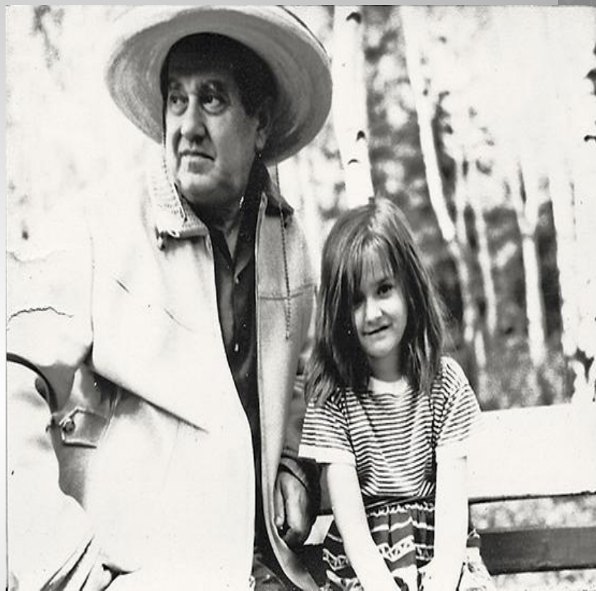
Драгунский с дочерью Ксенией