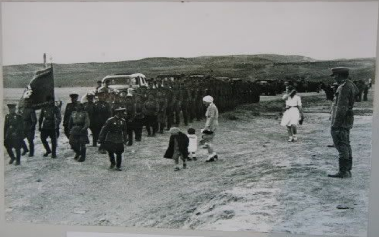
Тувинские добровольцы возвращаются с фронта