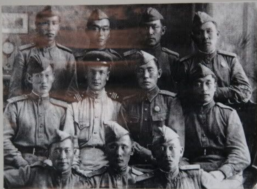
Тувинские танкисты-добровольцы перед отправкой на фронт г. Горький, сентябрь 1943г.