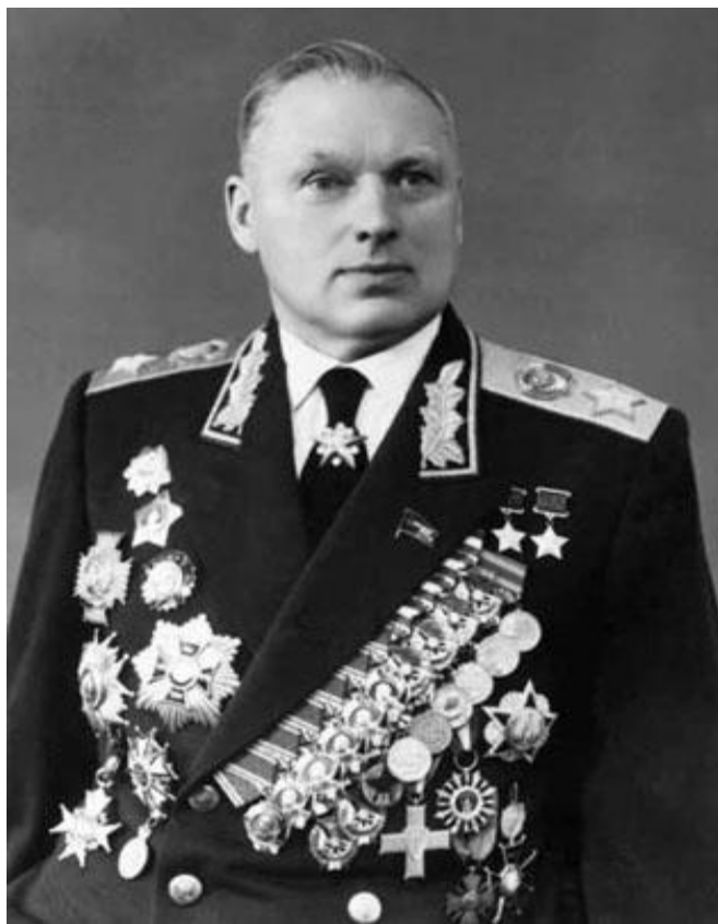
Рокоссовский К. К., маршал СССР