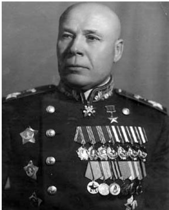
Тимошенко С.К., Маршал СССР