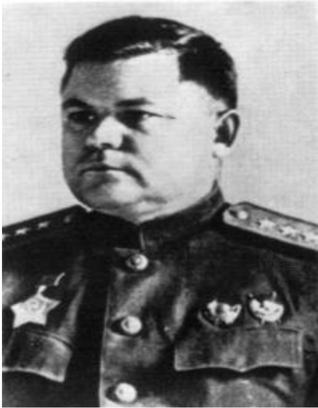
Ватутин Н.Ф., Генерал советской армии