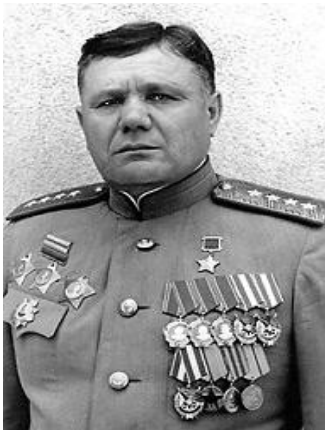
Еременко А.И., Маршал СССР.