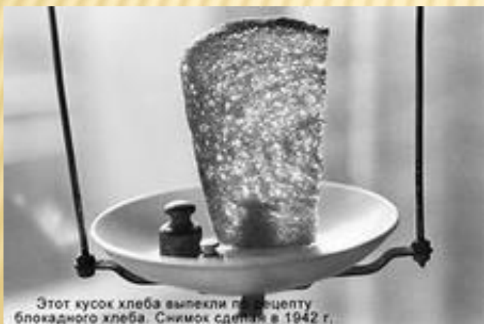
Этот кусок хлеба выпекли по рецепту блокадного хлеба. Снимок сделан в 1942 г.