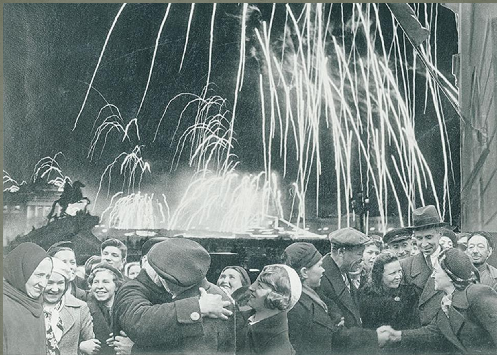
«ВЕЛИКАЯ ПОБЕДА ОДЕРЖАНА СОВЕТСКИМИ ВОЙСКАМИ ПОД ЛЕНИНГРАДОМ: