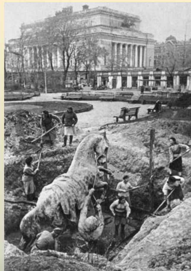
Аничков мост. Скульптурная композиция «Укрощение коня»