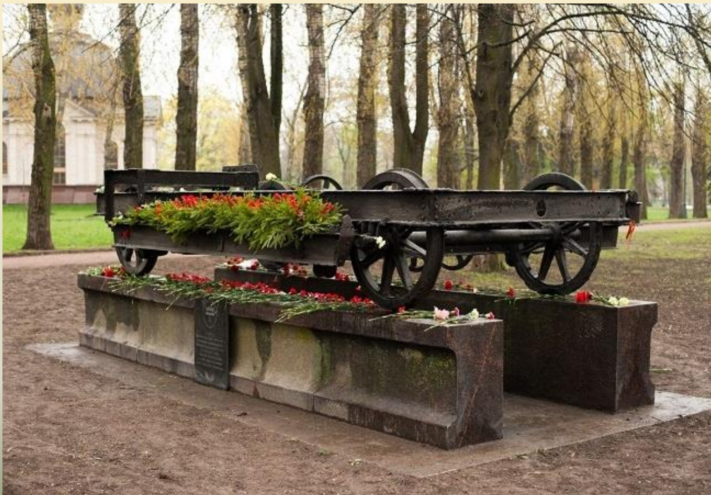
Памятный знак «Вагонетка»