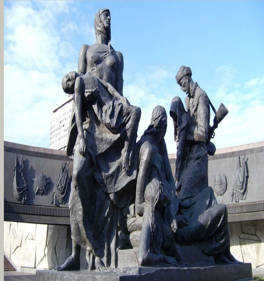
Памятник героическим защитникам блокадного Ленинграда.