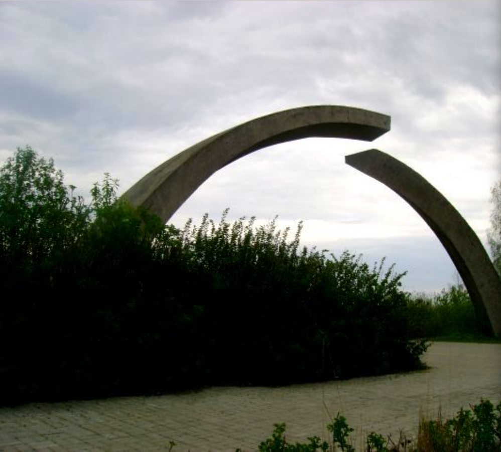
Памятник в честь разрыва блокады Ленинграда!