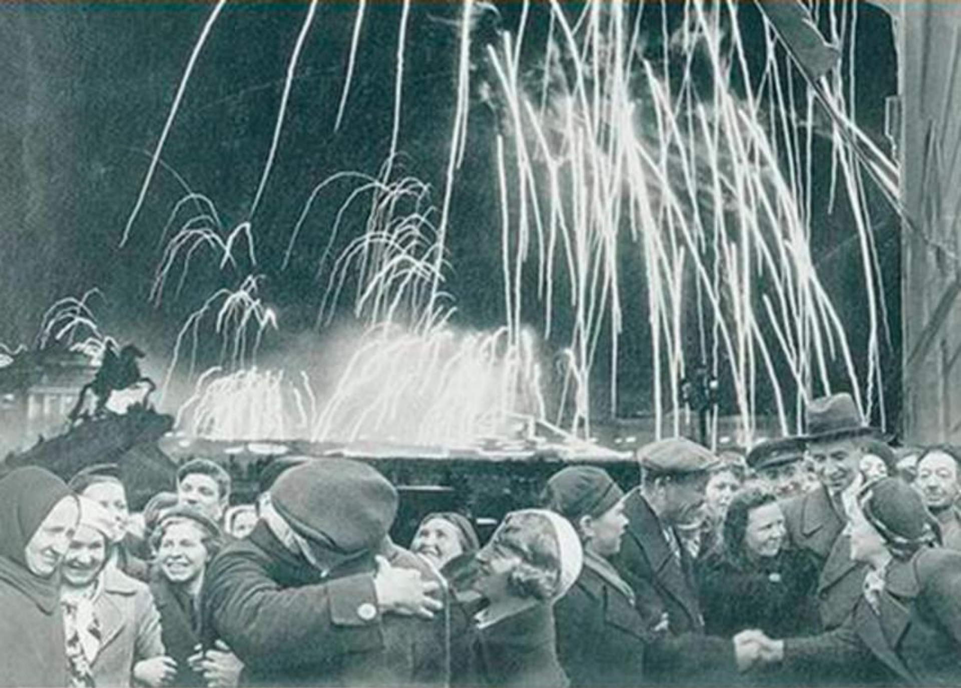
«Великая победа одержана советскими войсками под Ленинградом: