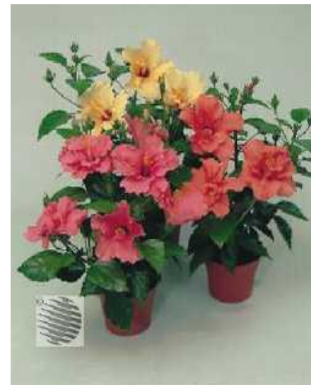
Китайская роза Монгольский лилия