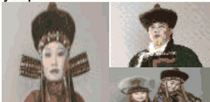
На фотографиях показаны стандартные бурят уборы