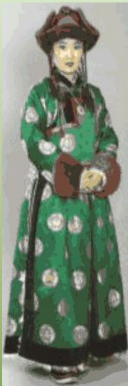
Женский и мужской костюмы