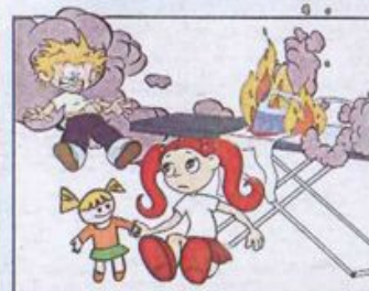
Залишені увімкненими електроприлади