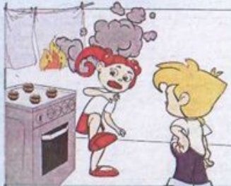
Неправильне користування газом та електроплитами