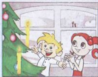
Ігри з вогнем