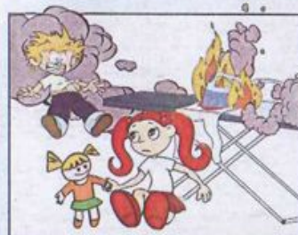
Залишені увімкненими електроприлади