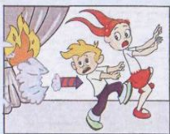
Феєрверки в приміщеннях