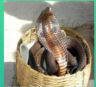
У королевской кобры достаточно яда, чтобы убить 20 человек или одно