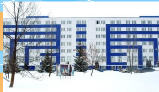
Саранский молочный завод