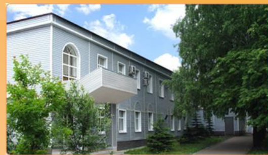
Саранский приборостроительный завод