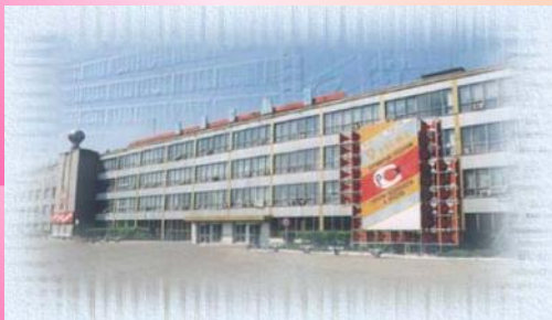
Ламповый завод «Лисма»