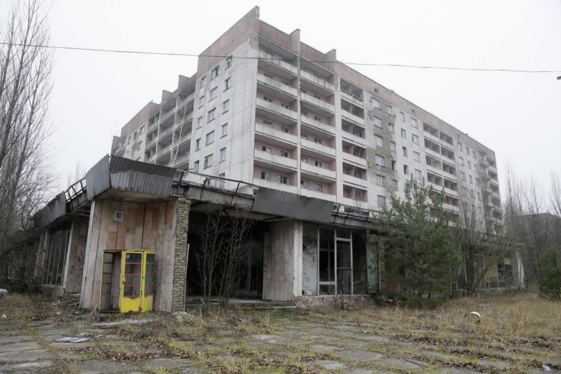
Пустующие дома в Припяти.