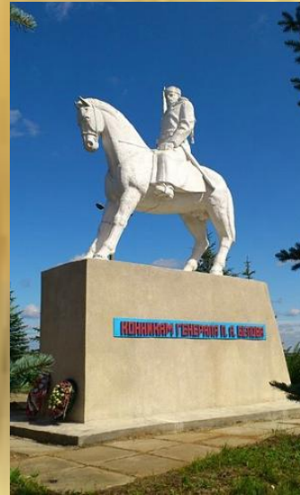
Памятник конникам генерала Белова.