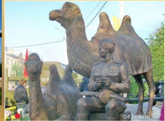
Памятник верблюдам в Астраханской области.