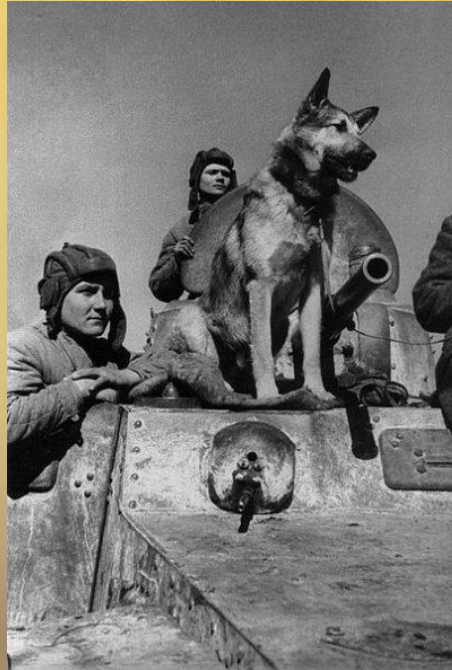
Овчарка Джульбарс, награждённая медалью «За боевые заслуги».