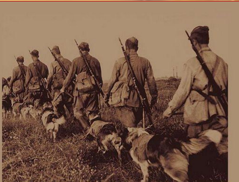
фото 1942 года . Фронтовые собаки -Бойцы со своими проводниками.

Пусть мины рвутся, пули свищут, - Собака под огнем пройдет, На поле раненых разыщет, К ним санитаров приведет.