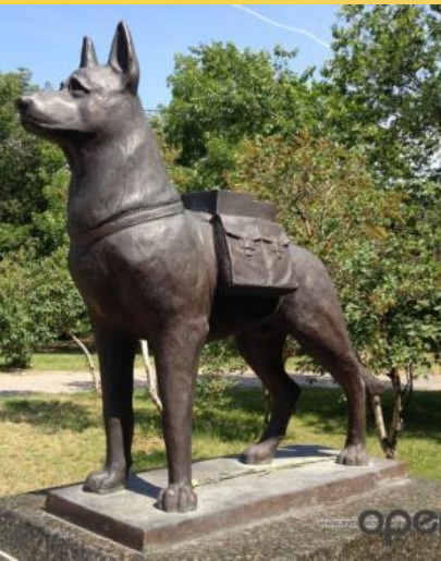
Памятник собакам – подрывникам м В Волгограде.