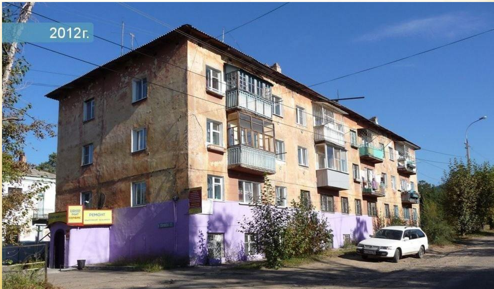
Улица Токмакова, город Чита