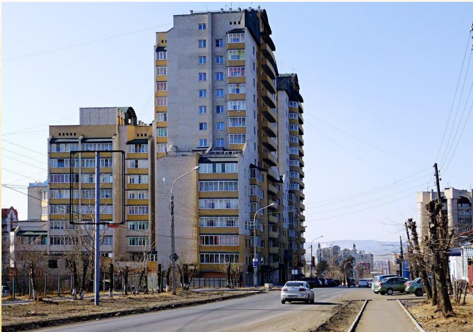
Улица Подгорбунского, город Чита