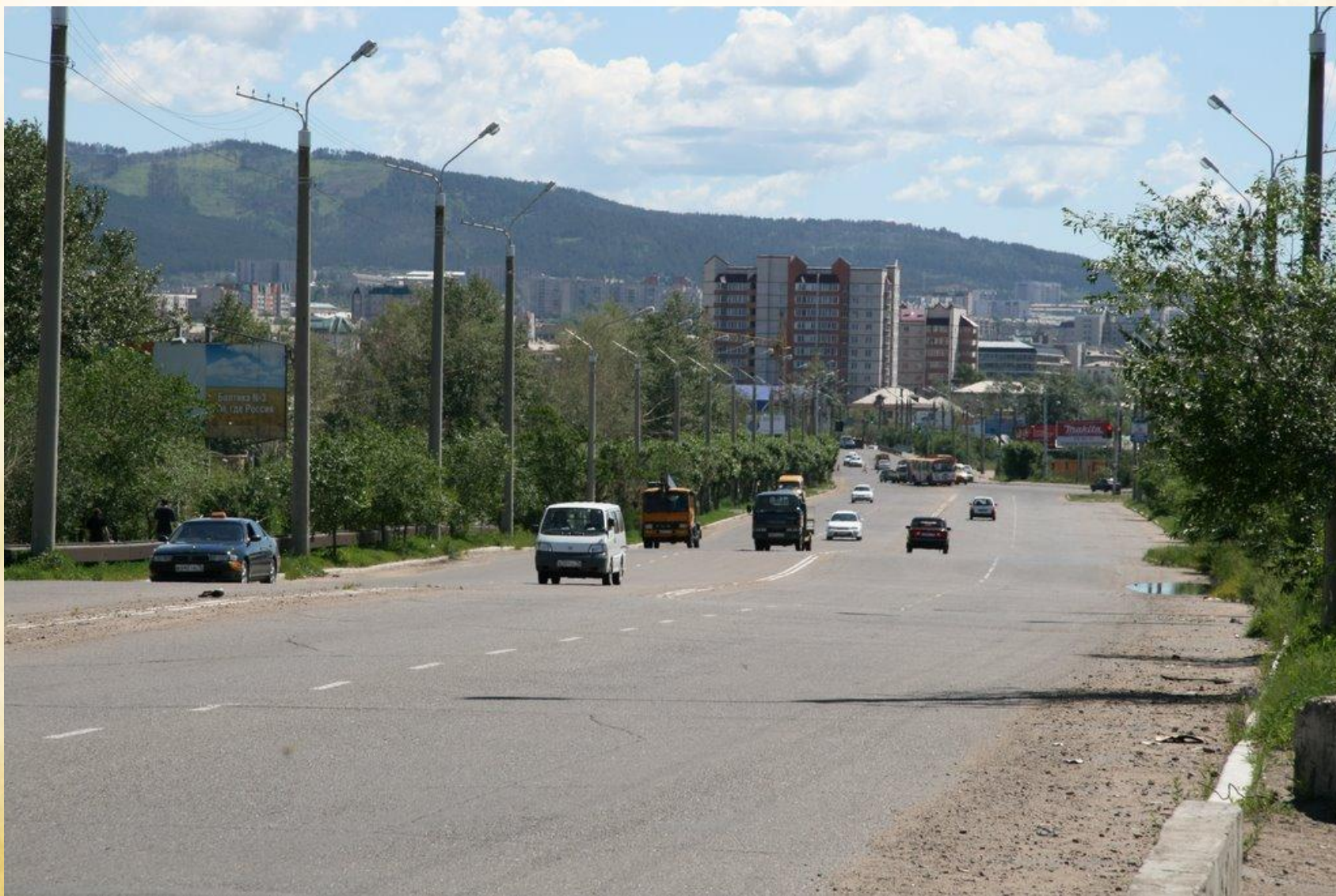
Улица Генерала Белика, город Чита