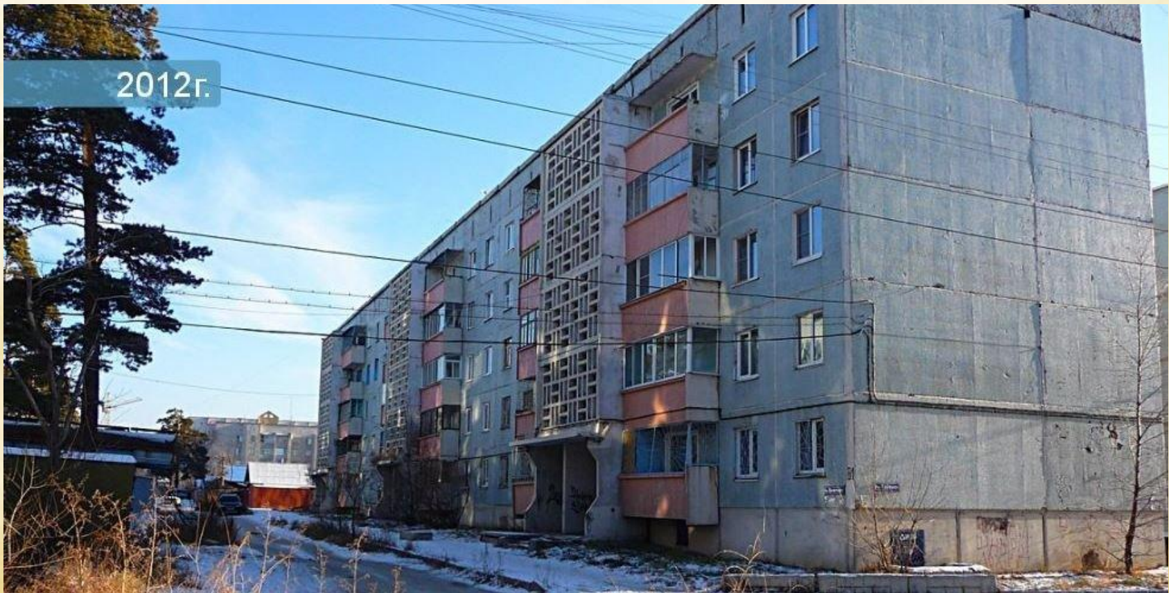
Улица Кочеткова, город Чита