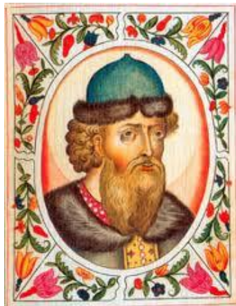
Великий князь киевский Владимир II Всеволодович Мономах

Лучшими человеческими качествами Златоуст считал доброту, скромность, терпимость и стремление к самосовершенствованию, причем их важность несомненна и в наше время.