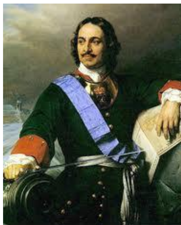
Портрет Петра I. Поль Деларош (1838г.)