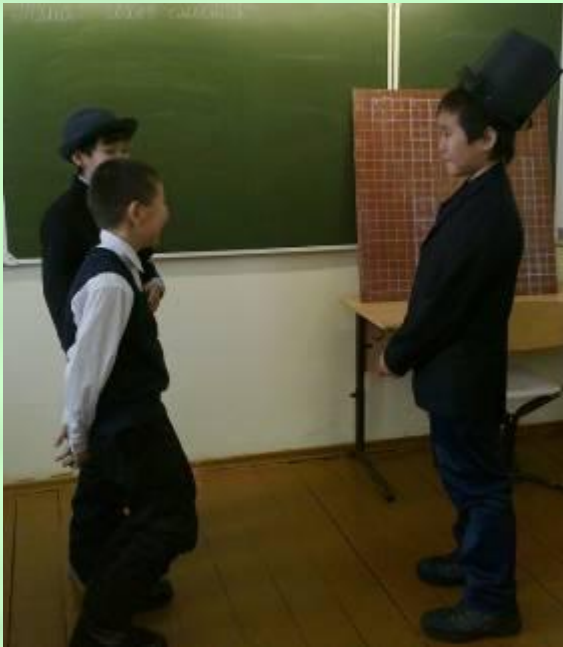
«Толстый и тонкий»

Создавая смешной рассказ, Чехов проявляет неистощимую фантазию и изобретательность. Постарайтесь и вы, ребята, включив воображение, инсценируя рассказы писателя.