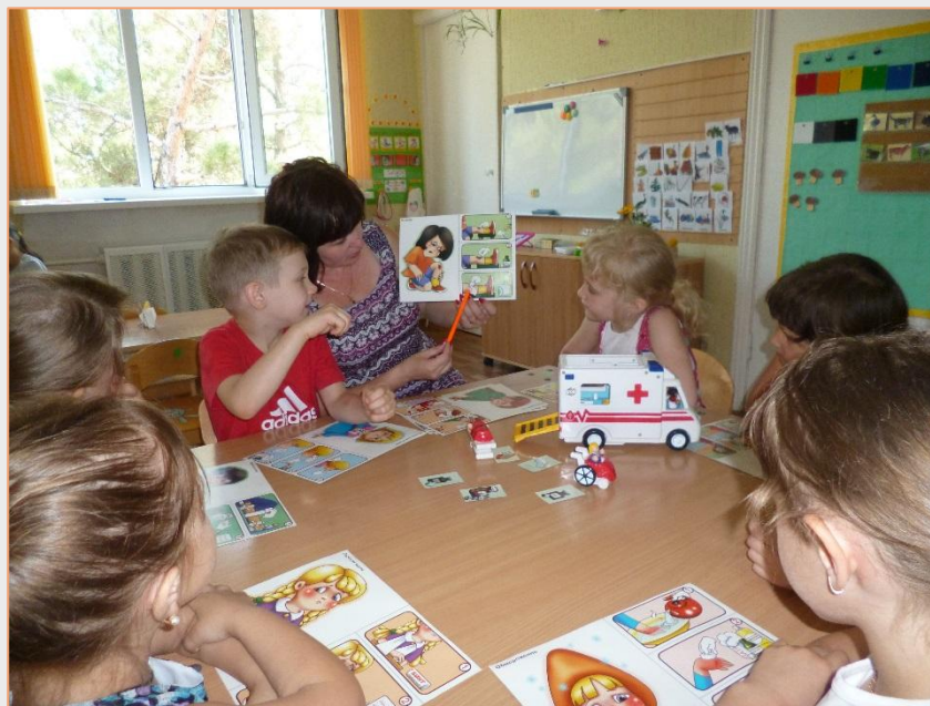
Предварительная работа к СРИ «Поликлиника»