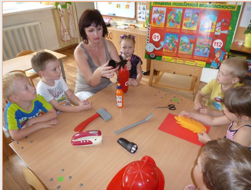
Предварительная работа к СРИ «Мы спасатели»