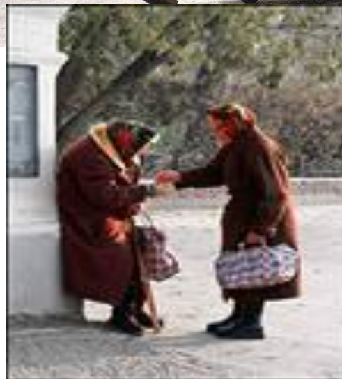
Prezgodna izgledni avtorizemni na yitkup © 2010 J. Bichkova. Pajon