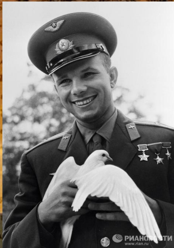
Юрий Алексеевич Гагарин (1934- 1974г. г.)