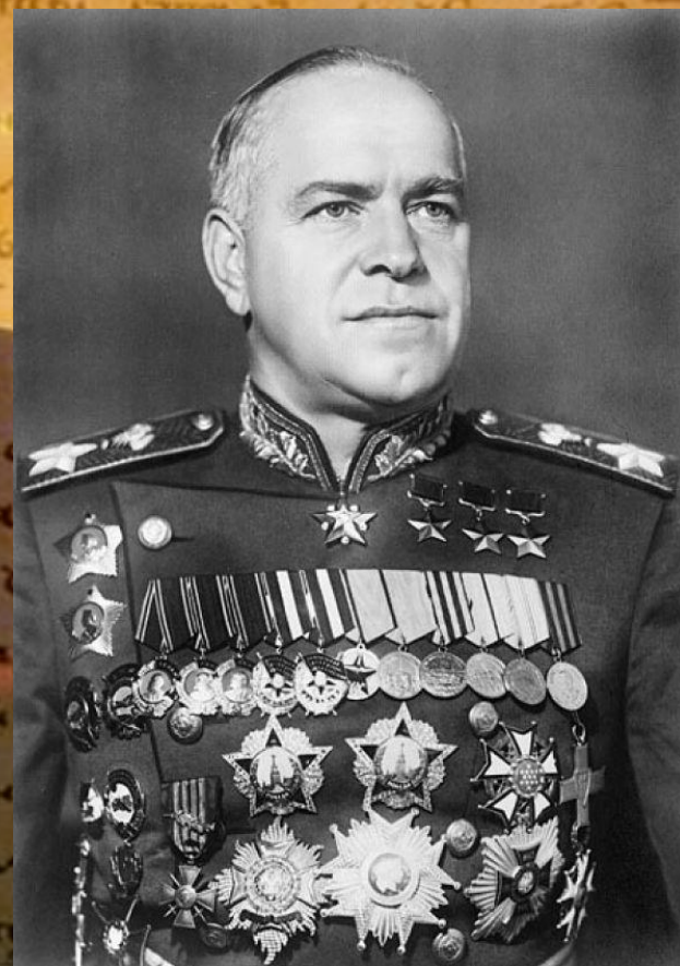
Георгий Константинович Жуков (1896-1974 г.г.)