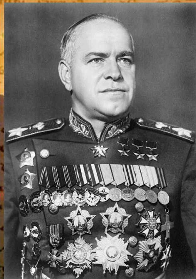
Георгий Константинович Жуков (1896-1974 г.г.)