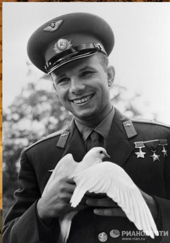
Юрий Алексеевич Гагарин (1934- 1974г. г.)