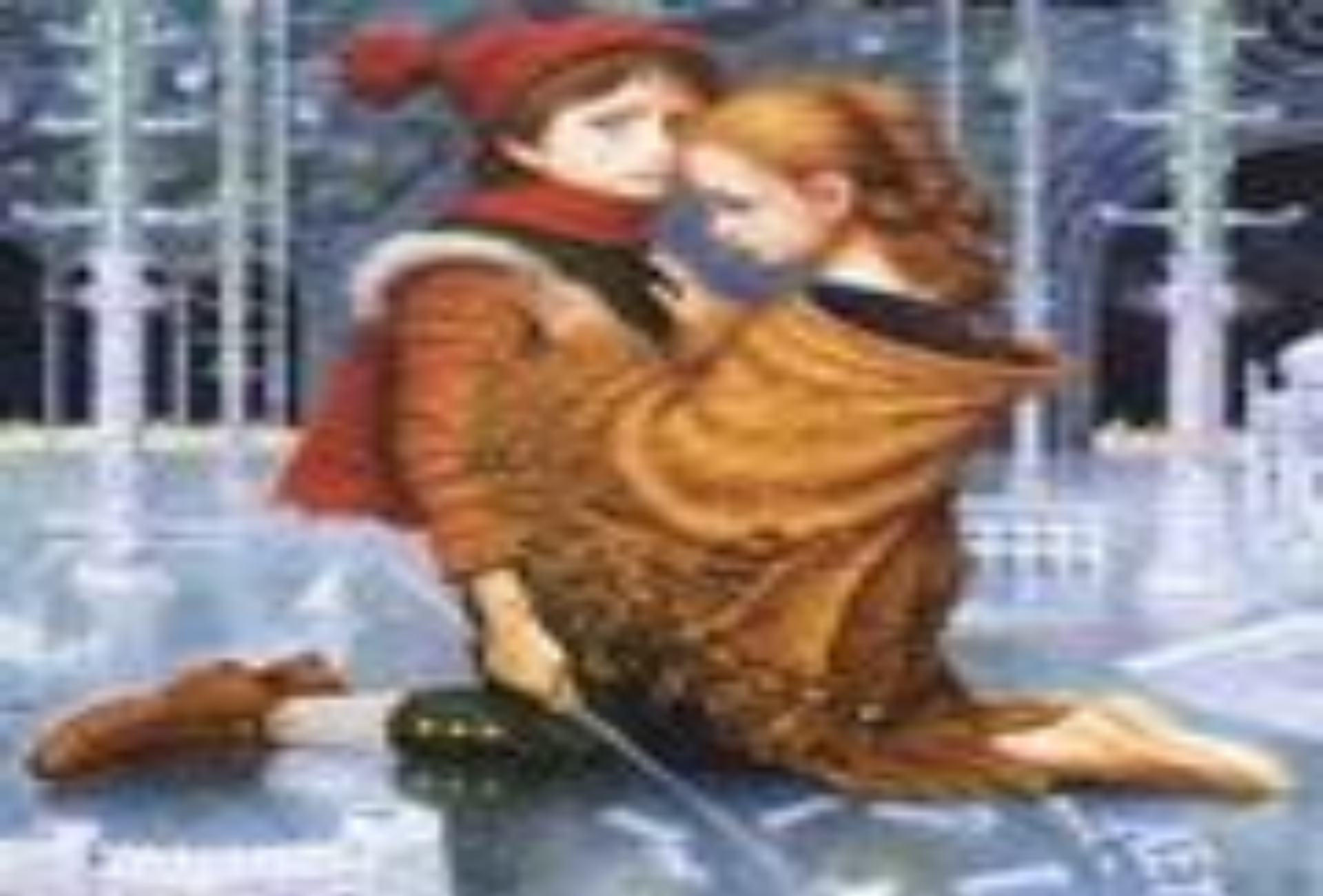
Кай и Герда