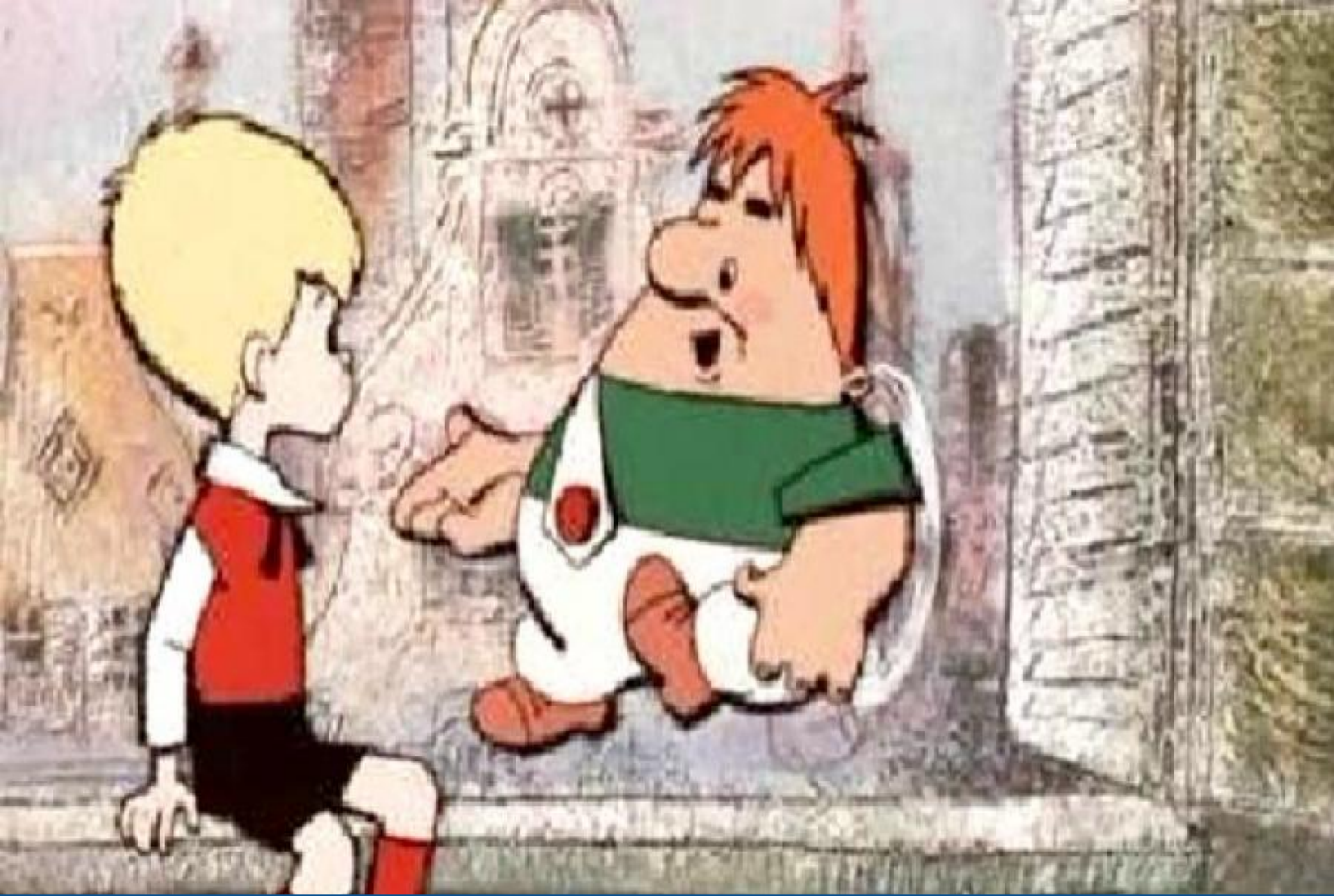
Малыш и Карлсон