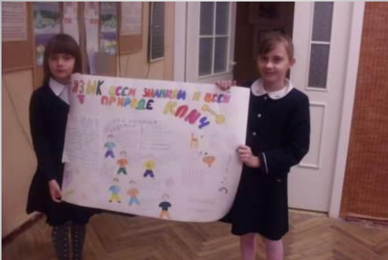
Стенная газета 3-б класса.