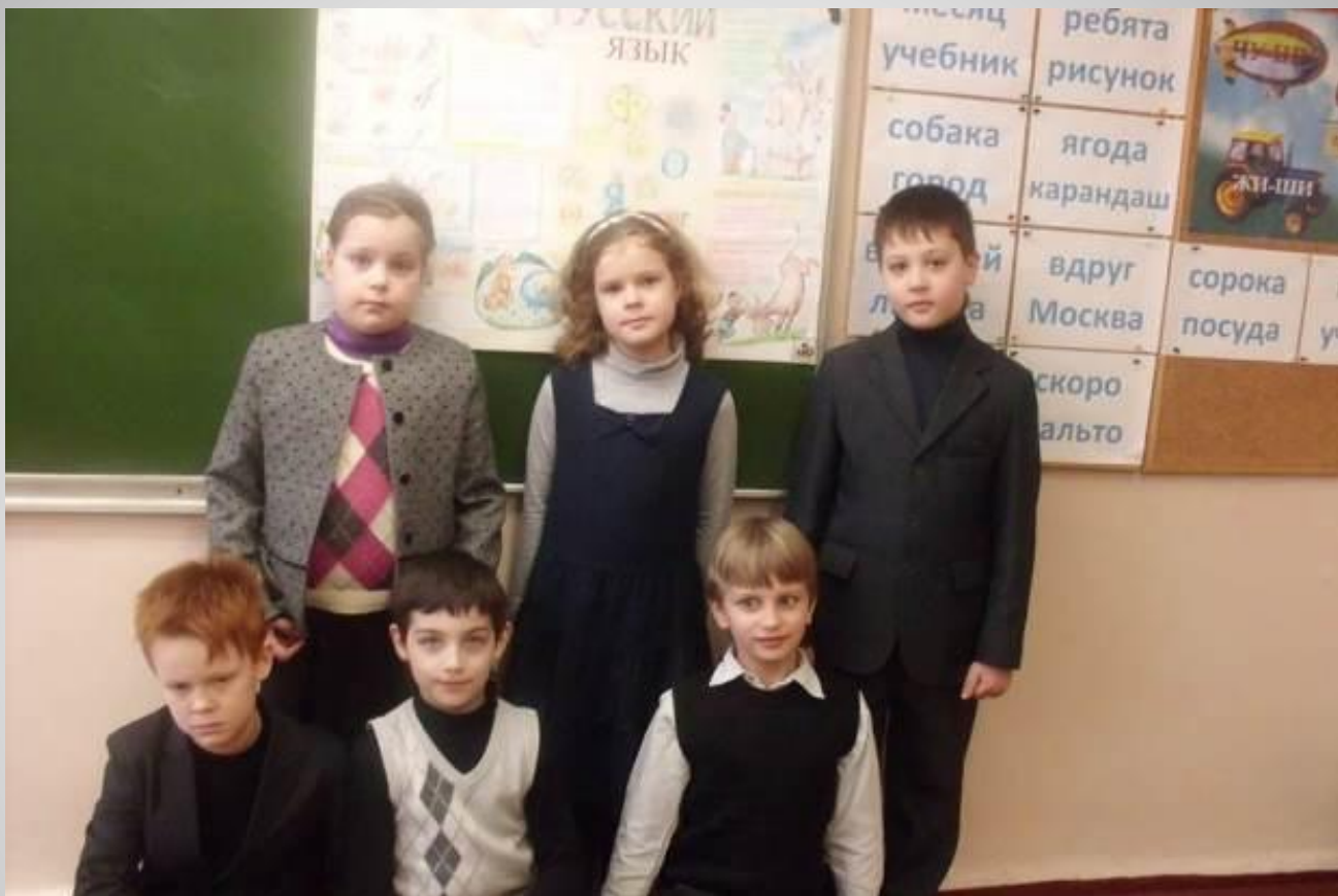
Стенная газета 2-6 класса.