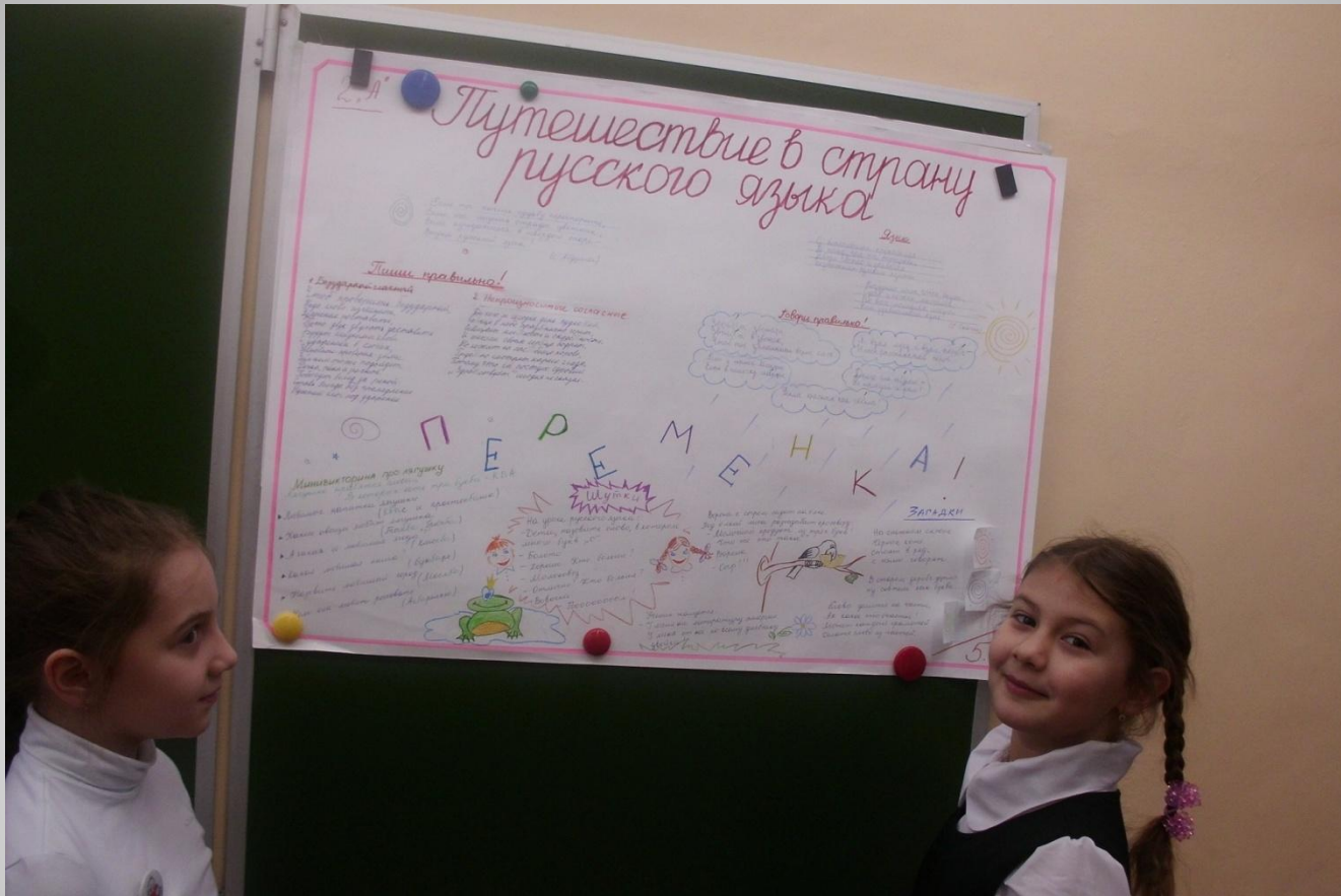
Стенная газета 2-а класса.