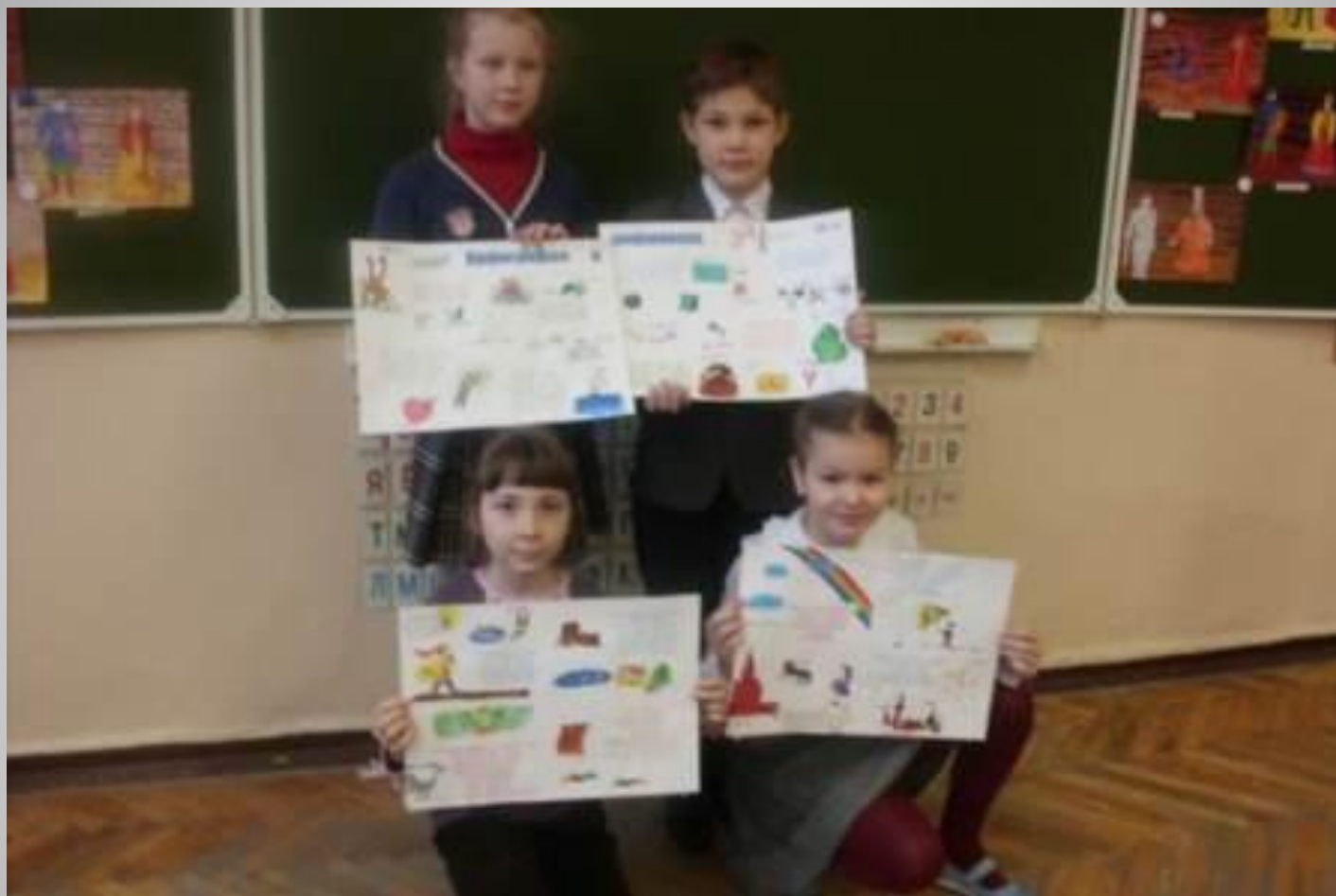
Стенная газета 3-а класса.