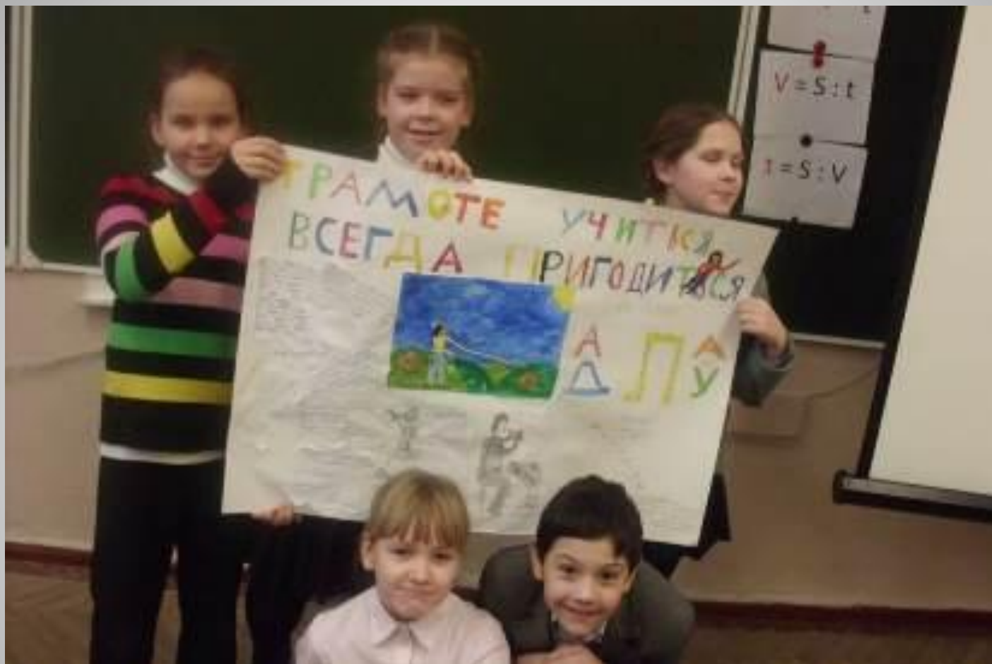
Стенная газета учеников 4-6 класса.