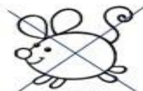
а не мышь.