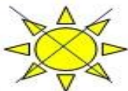
а не солнце.