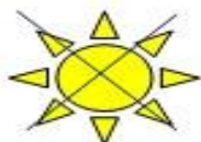
а не солнце.