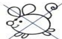
а не мышь.