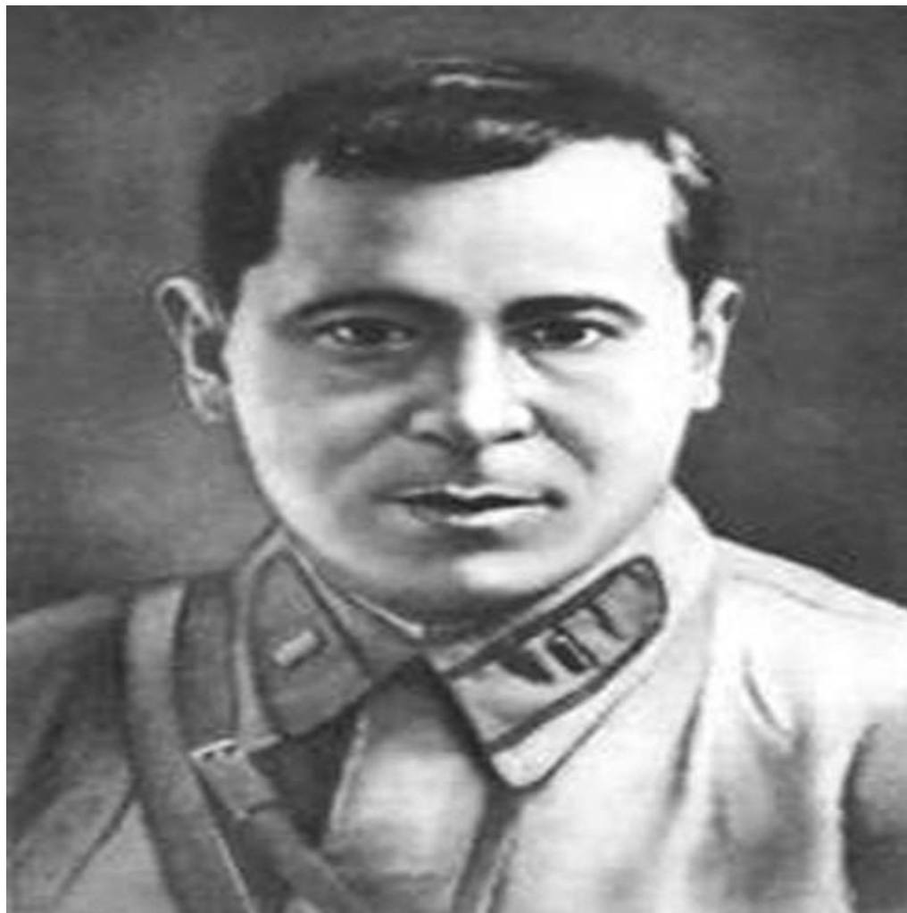
Муса Джалиль 1906-1944