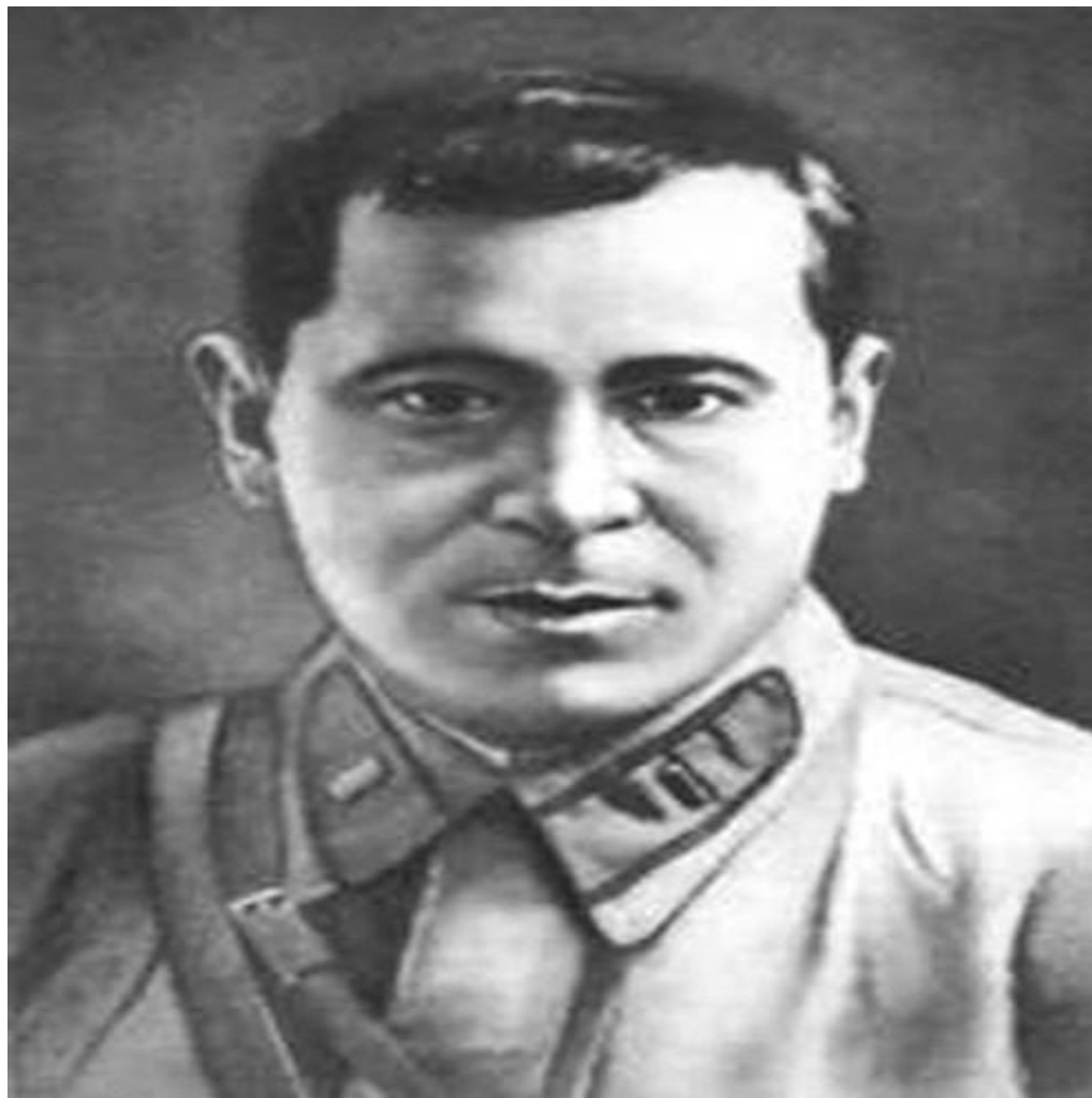
Муса Джалиль 1906-1944