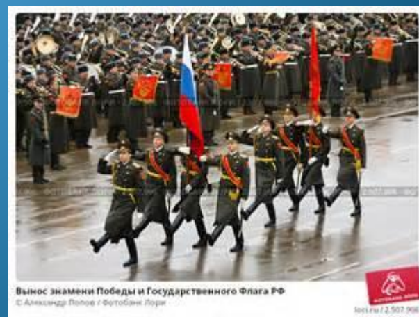
Вынос знамени Победы и Государственного Флага РФ