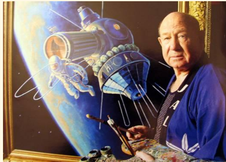
Алексей Архипович Леонов