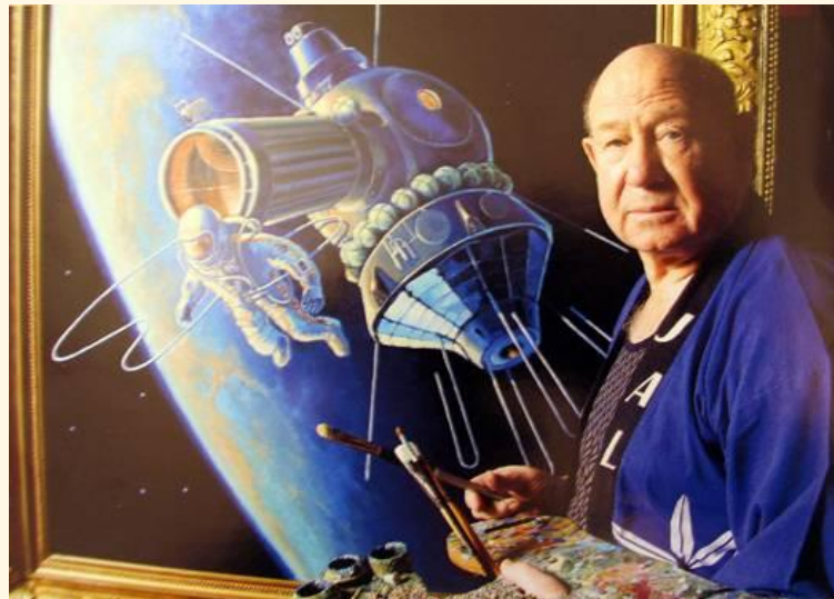
Алексей Архипович Леонов