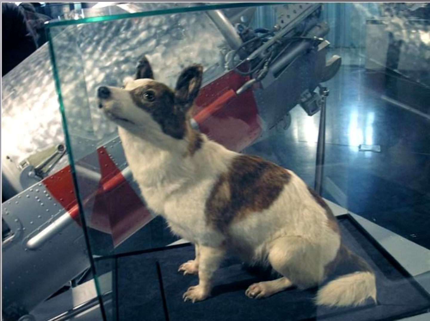
Стрелка в Музее Космонавтики