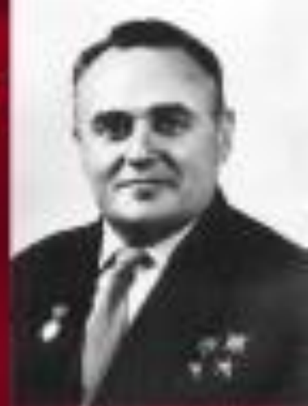
Генеральный конструктор – Сергей Павлович Королев

« Человечество не останется вечно на Земле, но в погоне за светом и пространством, сначала робко проникнет за пределы атмосферы, а затем завоюет себе все околосолнечное пространство».