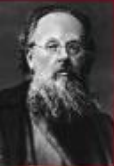
Константин Эдуардович Циолковский