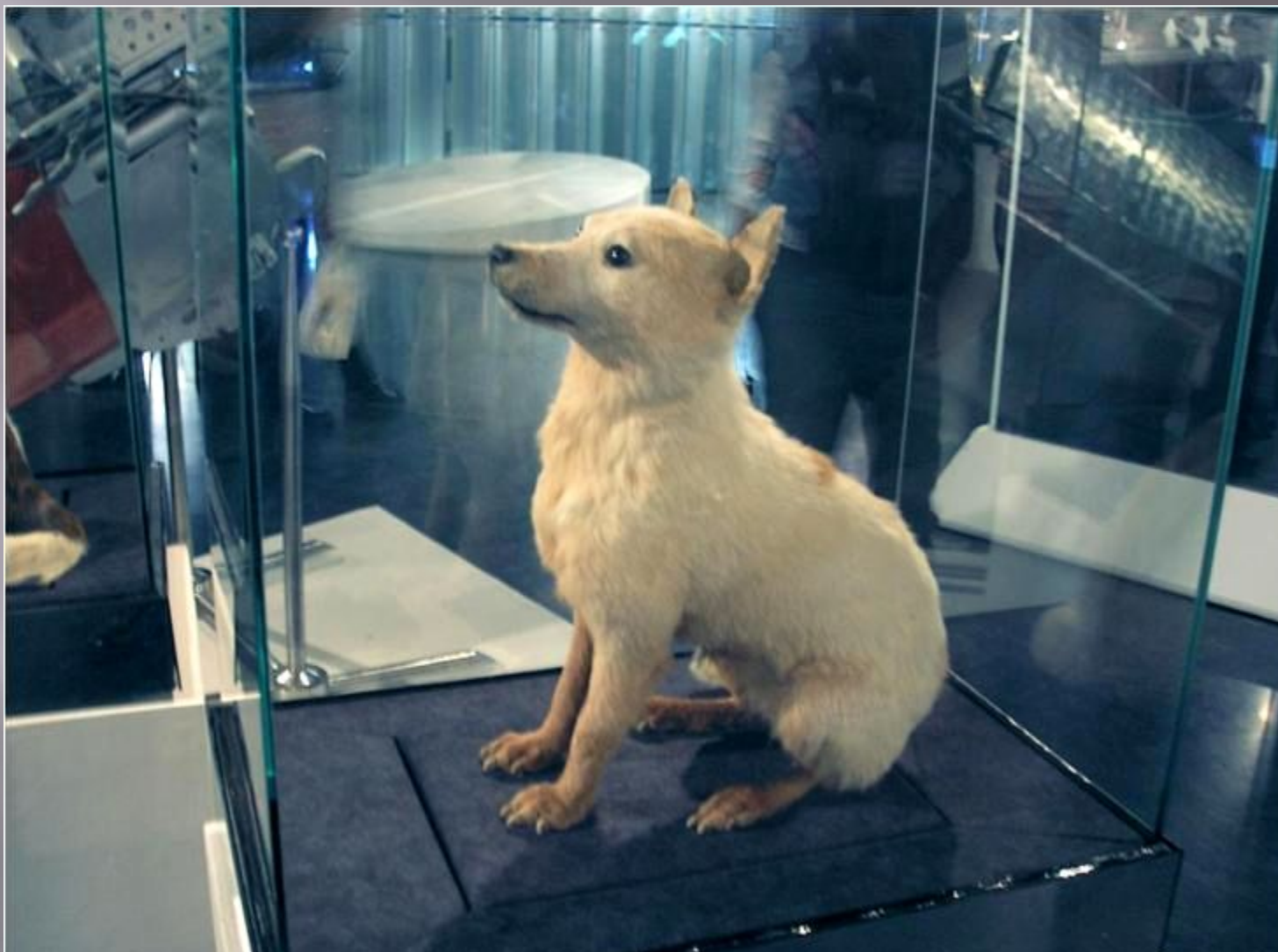
Белка в Музее Космонавтики