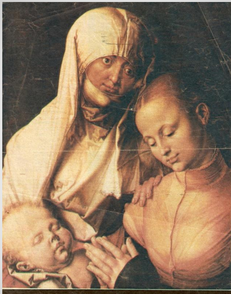
Альбрехт Дюдер «Богородица с Христом и святой Анной.1519г