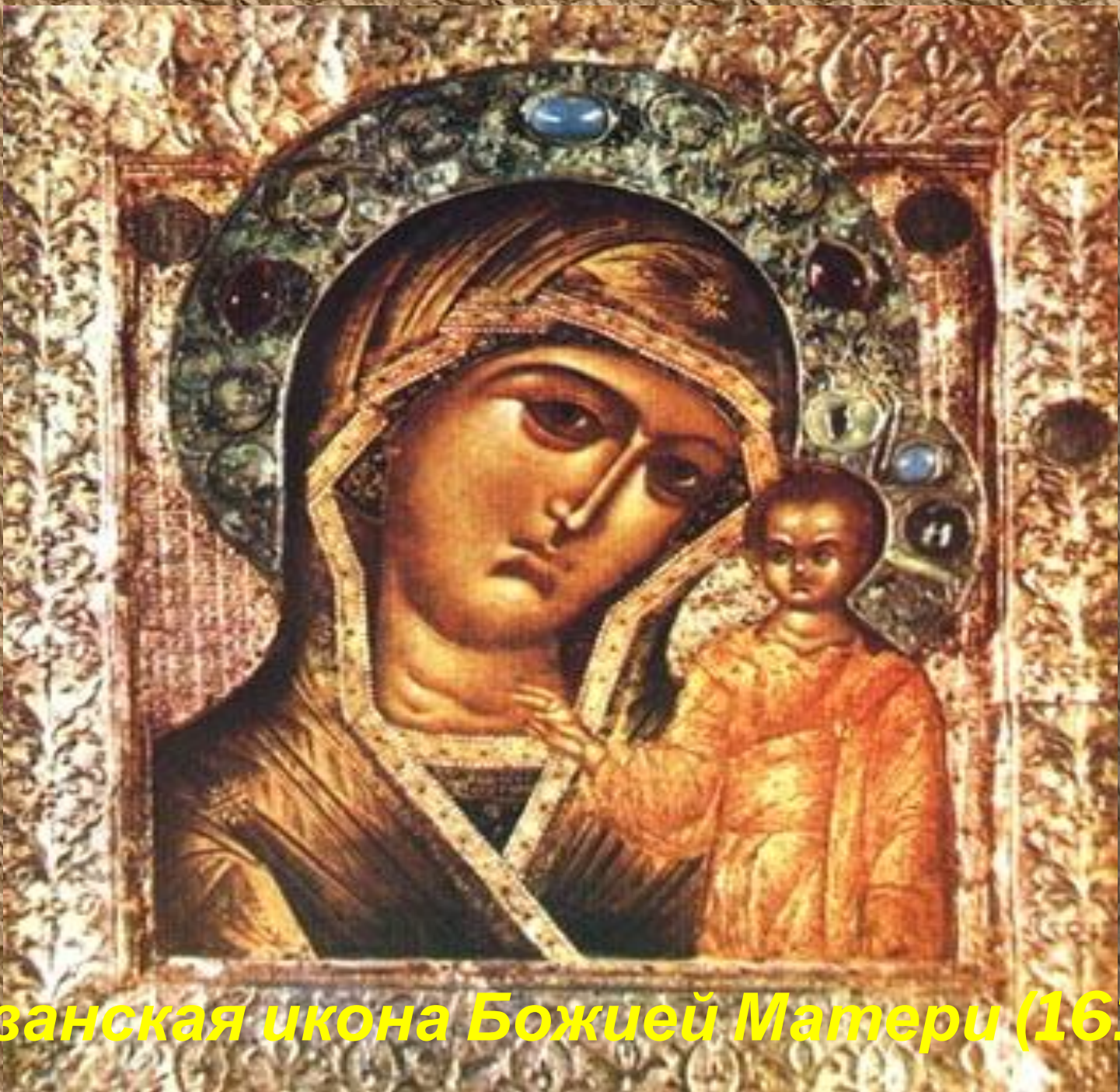
Казанская икона Божией Матери (1612)