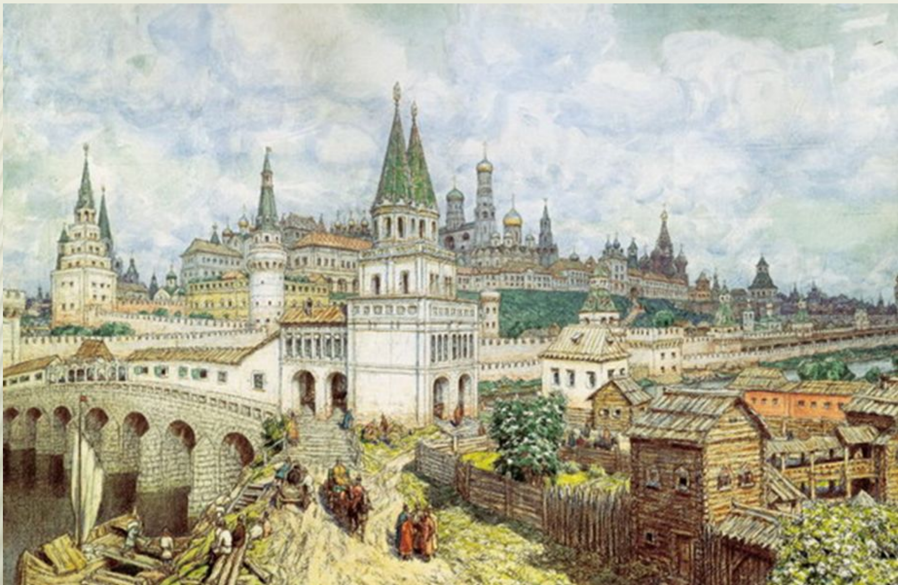
МОСКОВСКИЙ КРЕМЛЬ XVI — XVII ВВ.