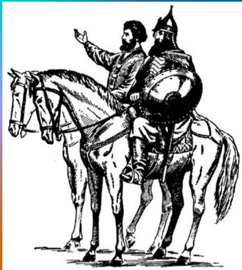
Дмитрий Пожарский и Кузьма Минин