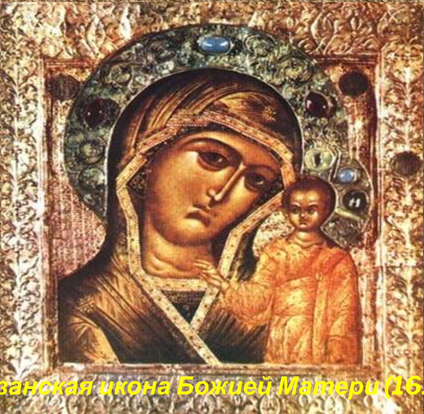
Казанская икона Божией Матери (1612)