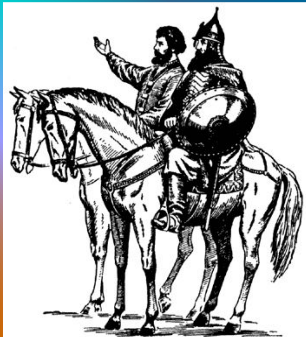
Дмитрий Пожарский и Кузьма Минин