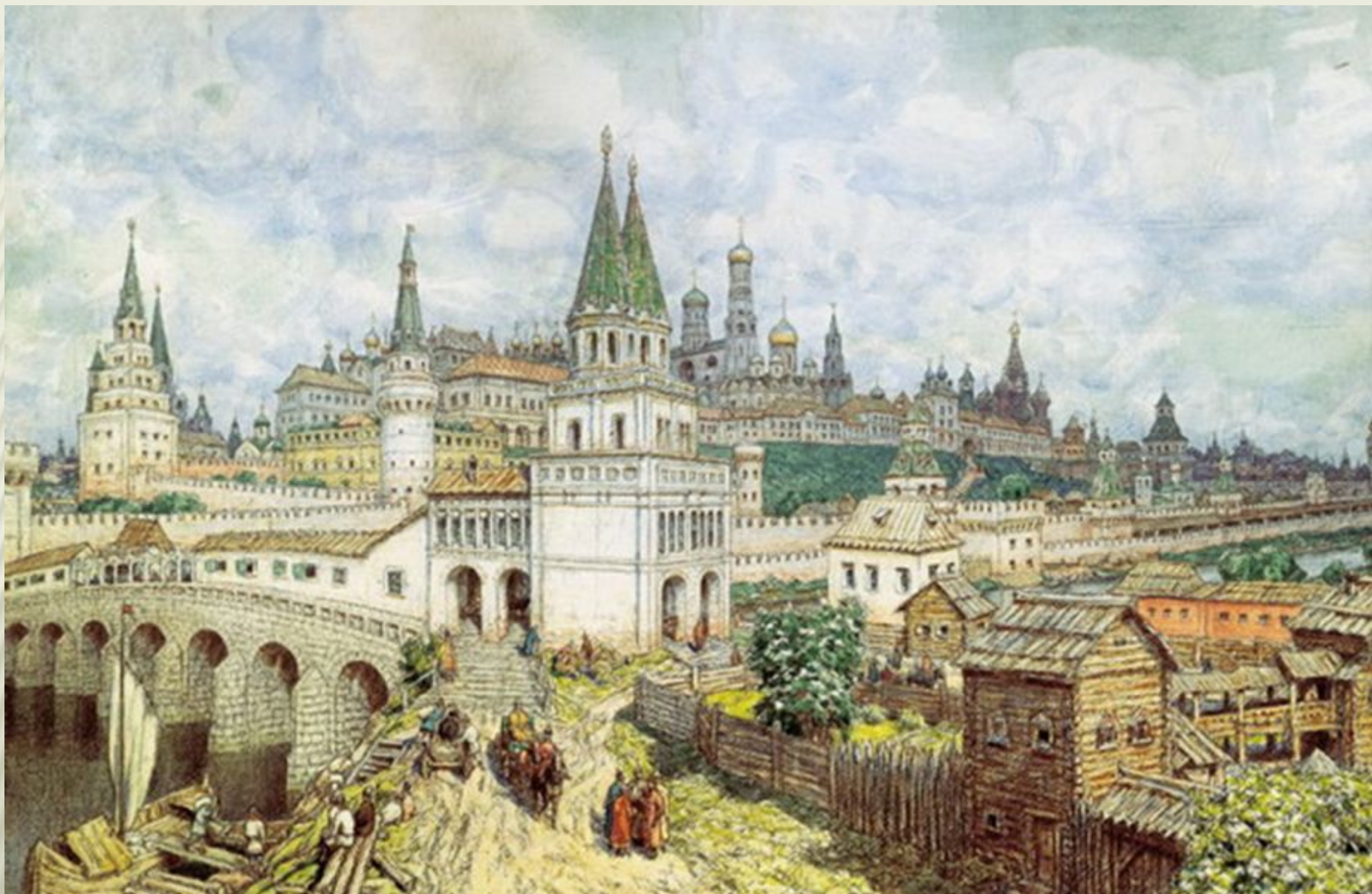
МОСКОВСКИЙ КРЕМЛЬ XVI — XVII ВВ.