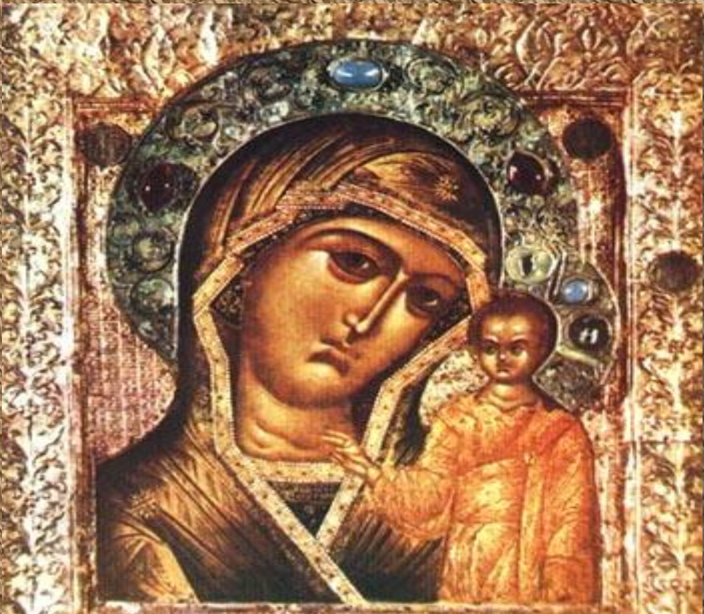
Казанская икона Божией Матери (1612)