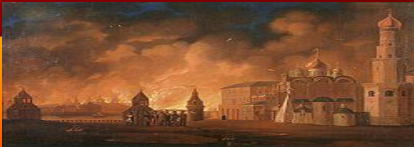
■ Горящая Москва

Поначалу трудно поверить, что через 200 лет в 1812 году единство народа вновь было подтверждено своей мощью, когда остатки Великой Армии Наполеона покидали Россию.