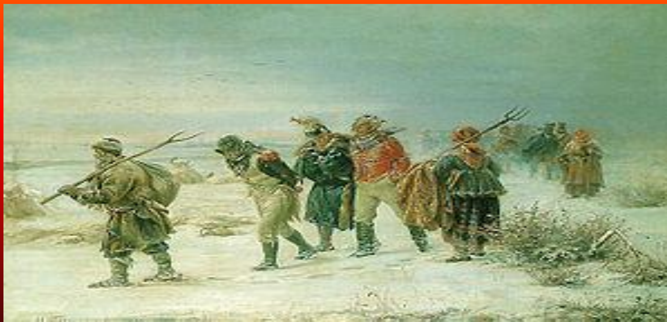
■ Зима. ■ Отступление французов