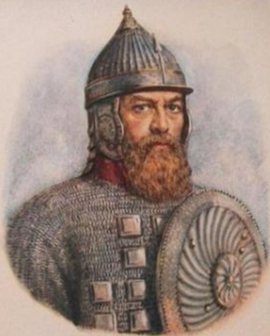
Дмитрий Пожарский 1578 – 1642