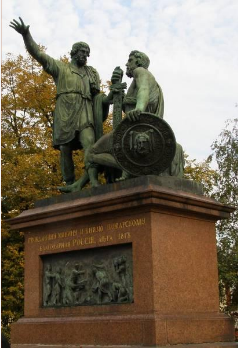
Памятник Минину и Пожарскому на Красной площади