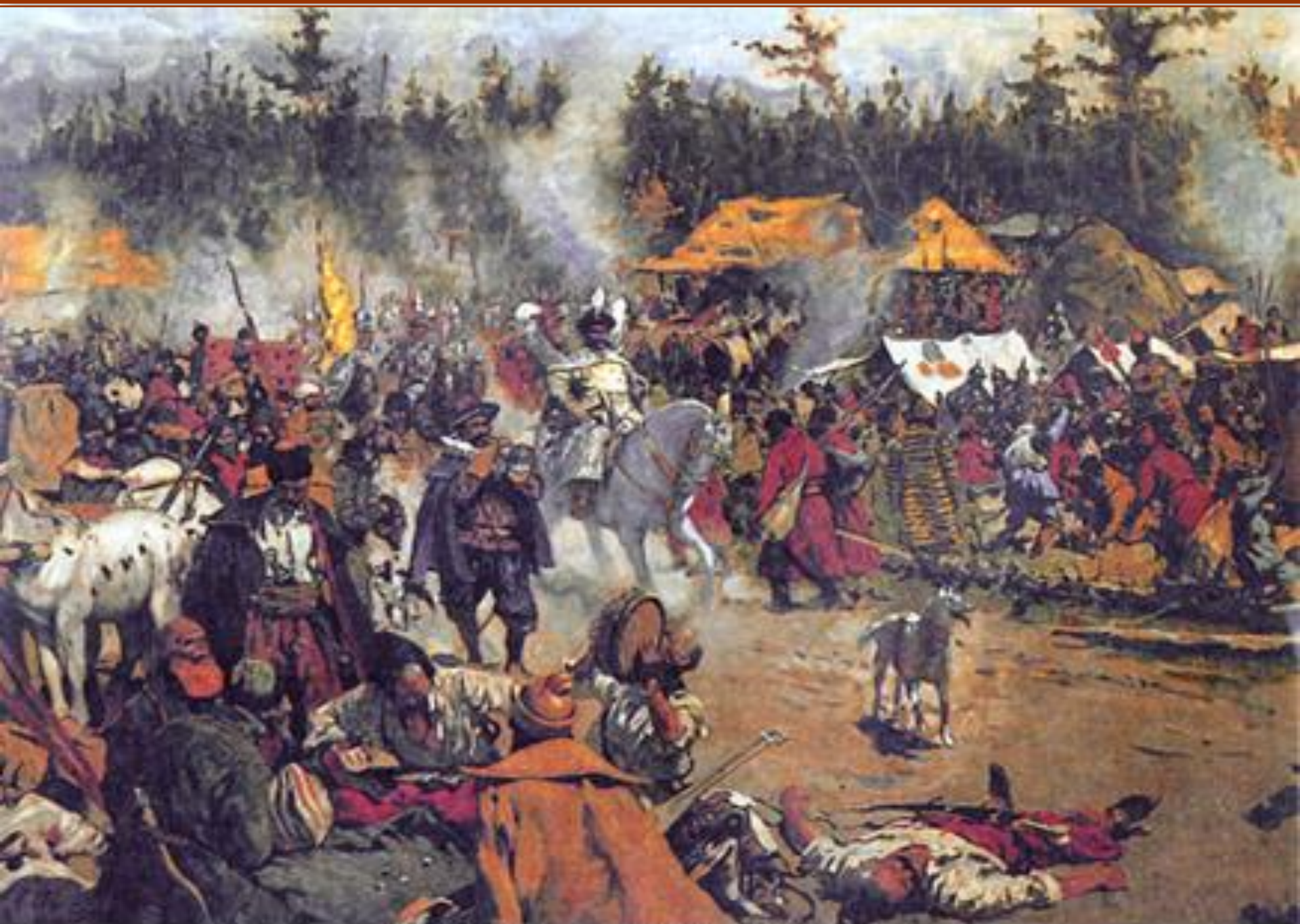
С.В. Иванов. "В смутное время"