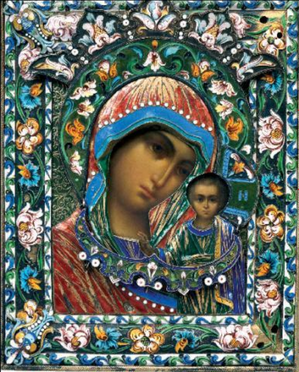
Казанская икона Пресвятой Богородицы