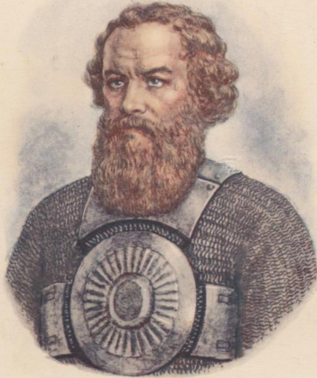
К узьма М инин

Кузьма́ (Козьма́) Ми́нин (полное имя Кузьма́ Ми́нич Заха́рьев Сухору́кий ) — русский национальный герой, организатор и один из руководителей Народного Ополчения в период борьбы русского народа против польской и шведской интервенции.