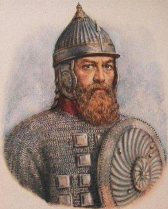
Дмитрий Пожарский 1578 – 1642