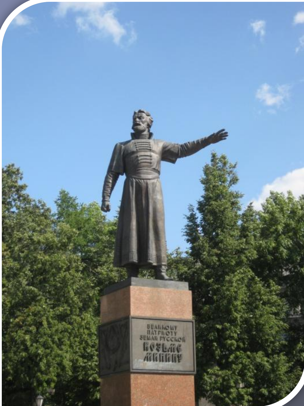
Памятник Минину в Нижнем Новгороде на площади Минину и Пожарскому