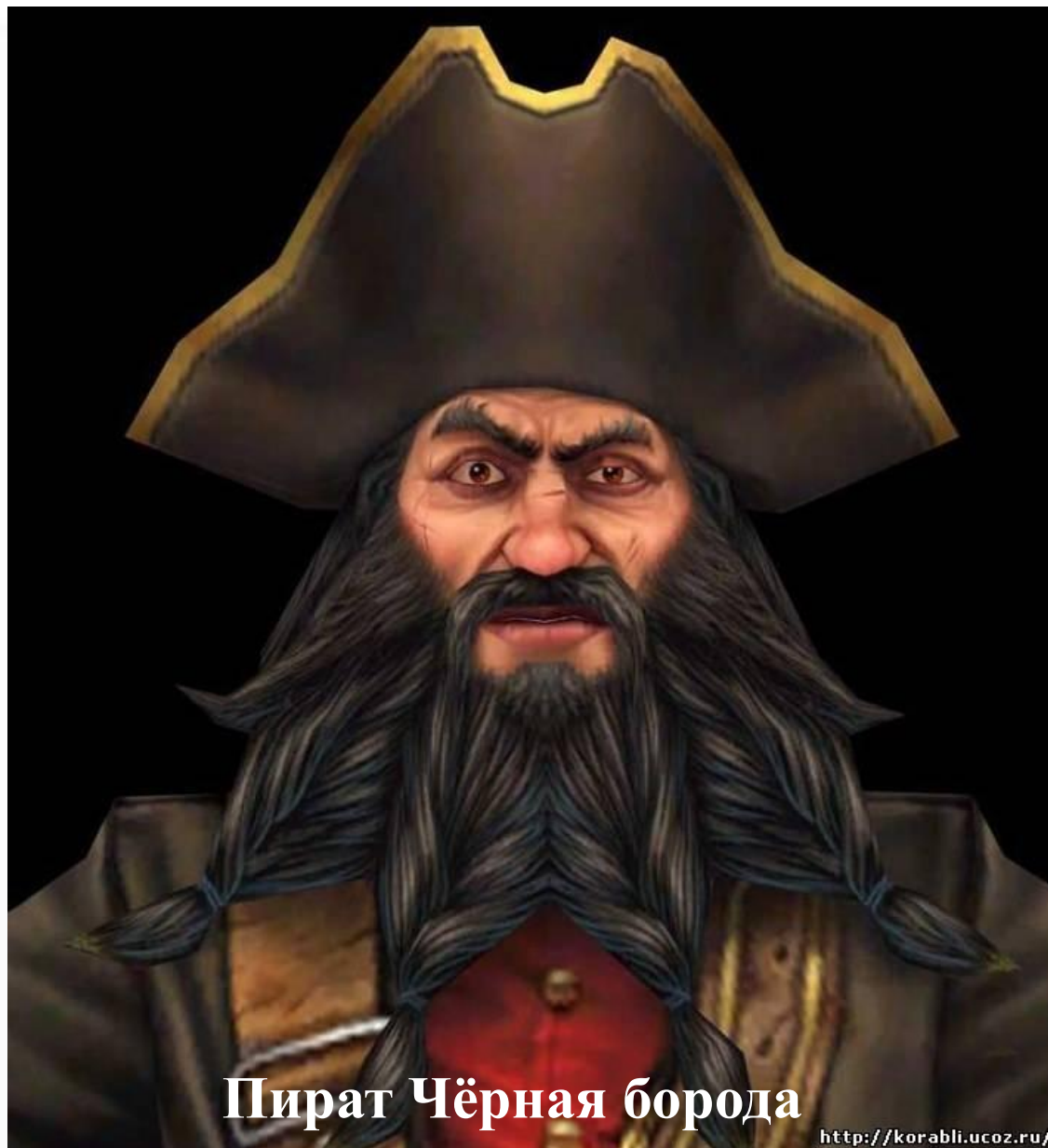
Пират Чёрная борода