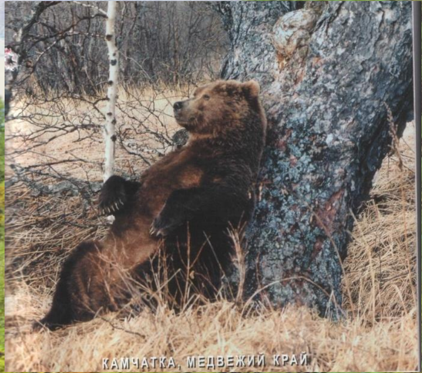
КАМЧАТКА, МЕДВЕЖИЙ КРАЙ