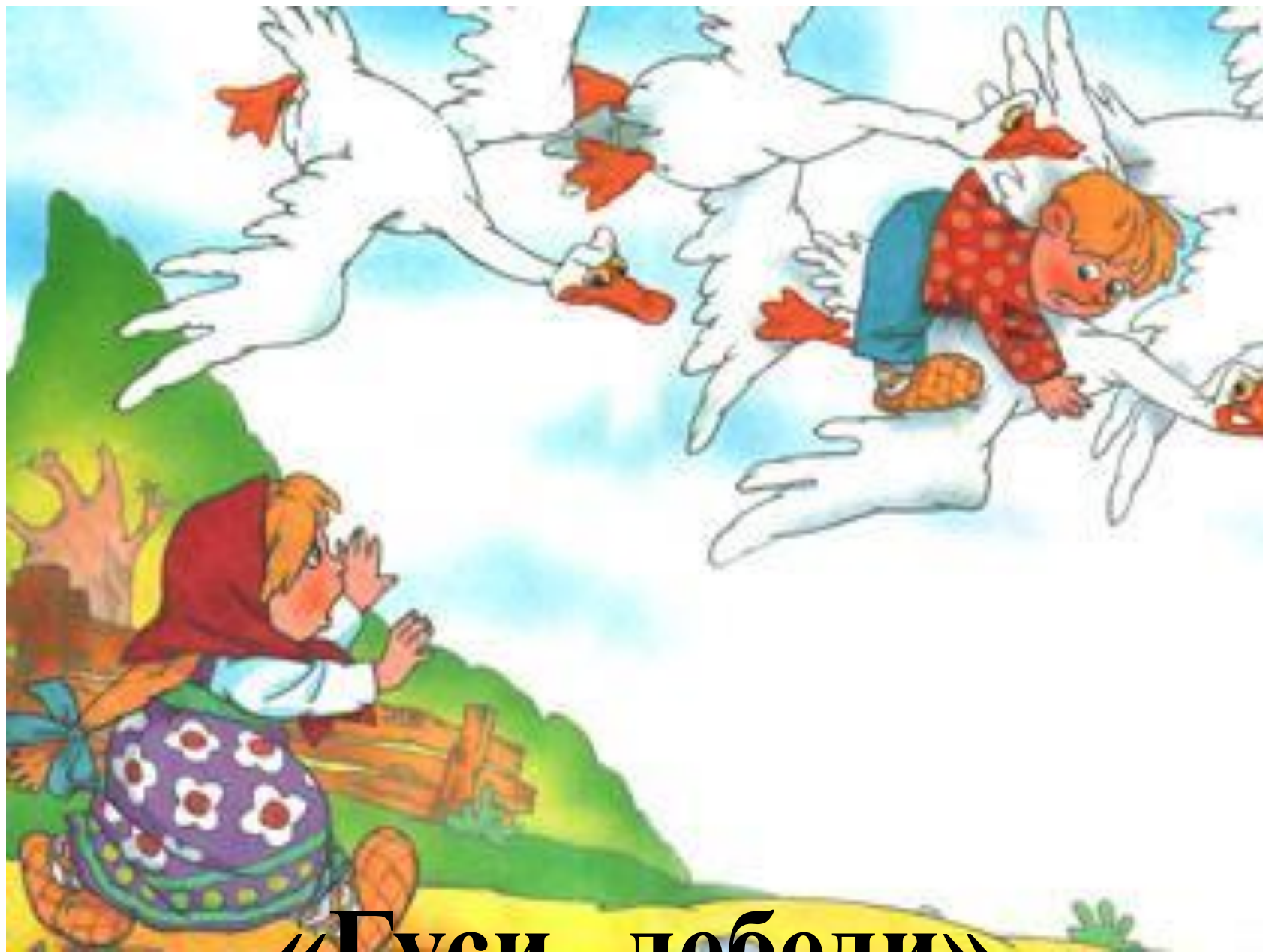
«Гуси - лебеди»