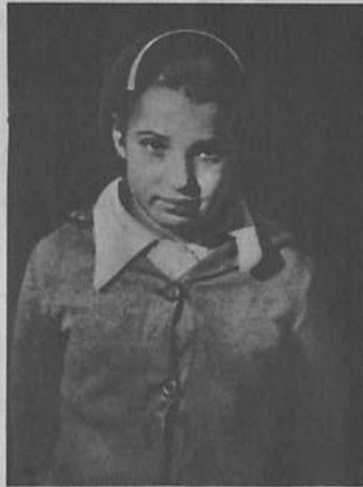
Таня Савичева. Фрагмент группового снимка

Весь мир потряс дневник маленькой ленинградской девочки Тани Савичевой: «Бабушка умерла 25 января...», «Дядя Алеша 10 мая...», «Мама 13 мая в 7.30 утра...», «Умерли все. Осталась одна Таня». Записки этой девочки, которая погибла в 1945 году в эвакуации, стали одним из грозных обвинений фашизму, одним из символов блокады.