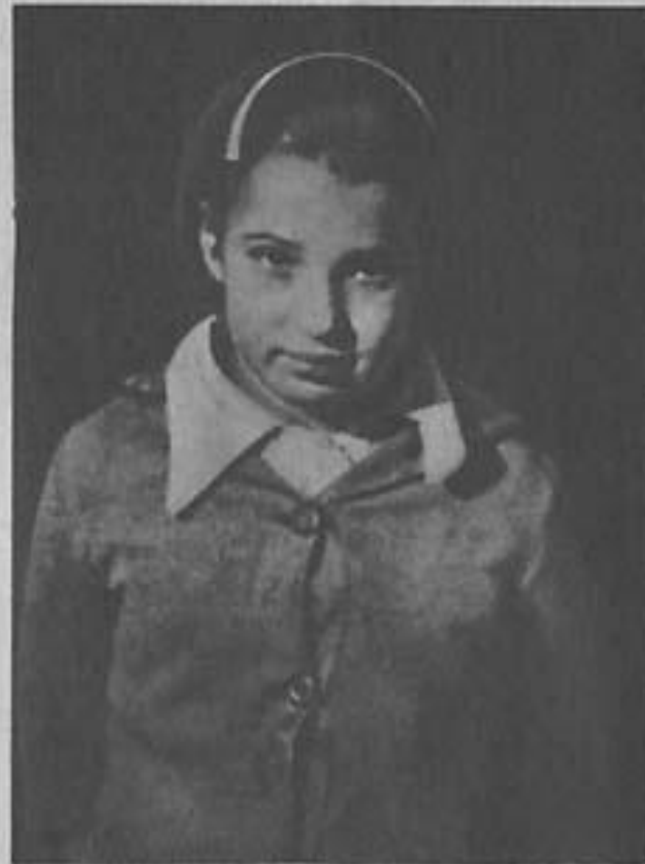
Таня Савичева. Фрагмент группового снимка

Весь мир потряс дневник маленькой ленинградской девочки Тани Савичевой: «Бабушка умерла 25 января...», «Дядя Алеша 10 мая...», «Мама 13 мая в 7.30 утра...», «Умерли все. Осталась одна Таня». Записки этой девочки, которая погибла в 1945 году в эвакуации, стали одним из грозных обвинений фашизму, одним из символов блокады.