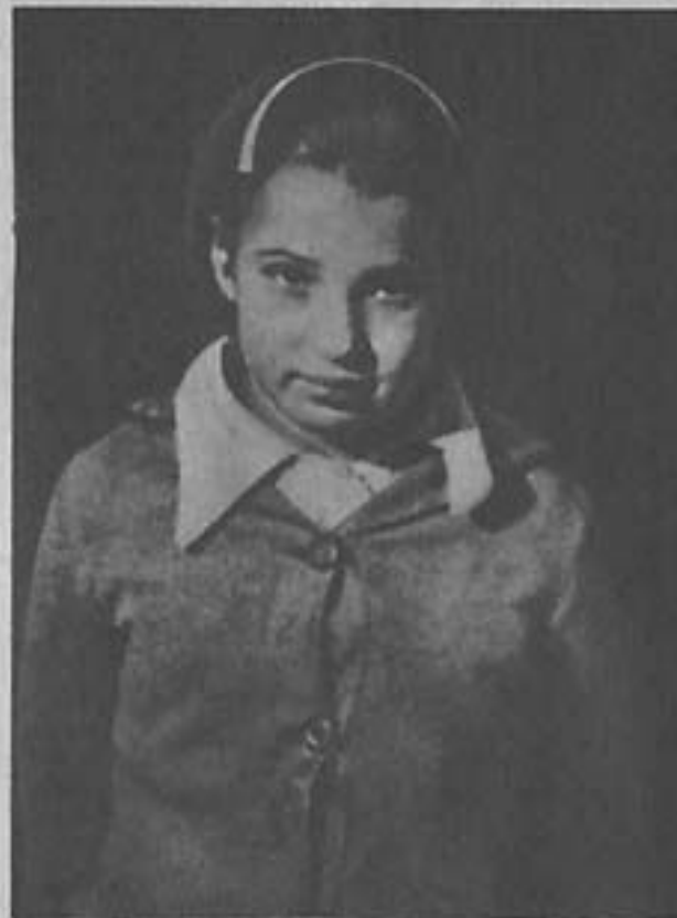
Таня Савичева. Фрагмент группового снимка